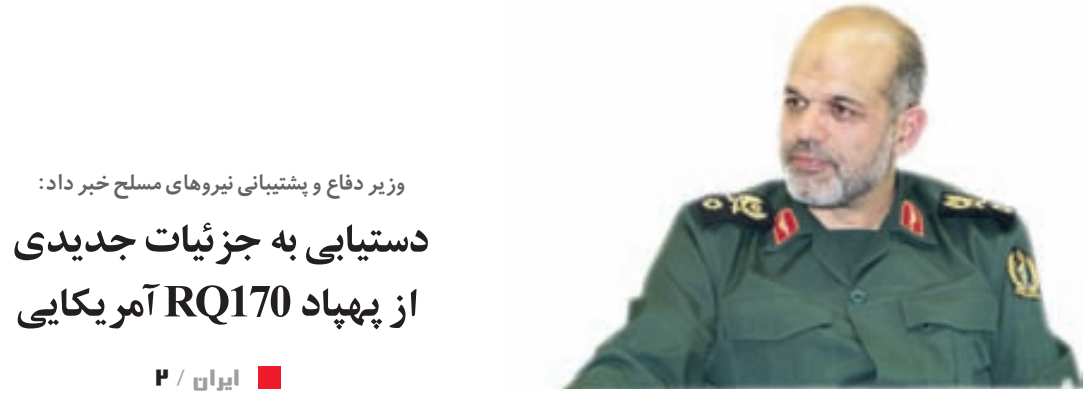
وزیر دفاع و پشتیبانی نیروهای مسلح خبر داد: دستیابی به جزئیات جدیدی از پهپاد RQ170 آمریکایی

سختگویی اقتصادی دولت از عدم افزایش قیمت حامل‌های انرژی خبر داد: