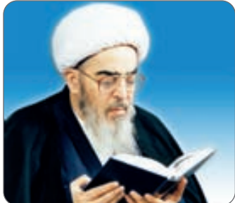
بسپح زهره قندهاری

آیت‌الله العظمی فاضل لنکرانی در کنار امر تدریس اهتمام جدی به نوشتن و تألیف داشت و در این زمینه خدمات مناسبی به حوزه‌های علمیه ارائه کرده‌است و از پرتألیف‌ترین مراجع معاصر بود.