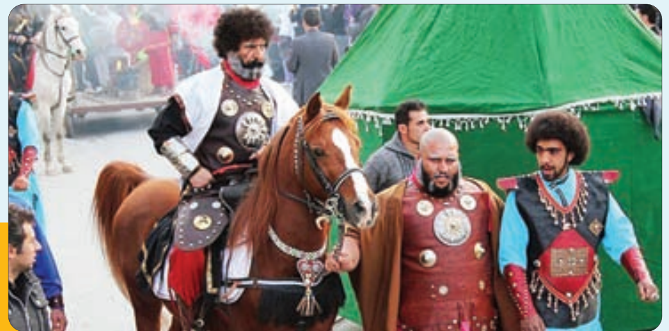
باز این چه شورش است که در خلق عالم است