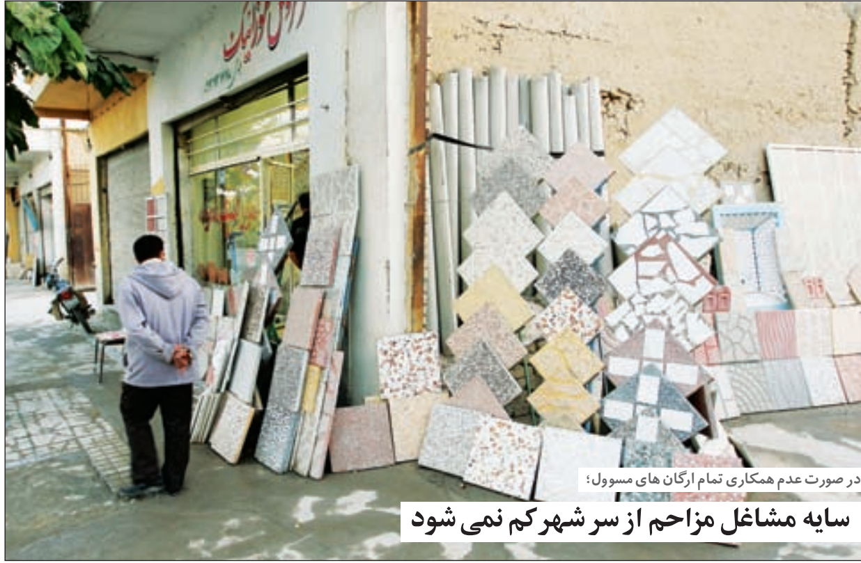
در صورت عدم همکاری تمام ارگان های مسوول: