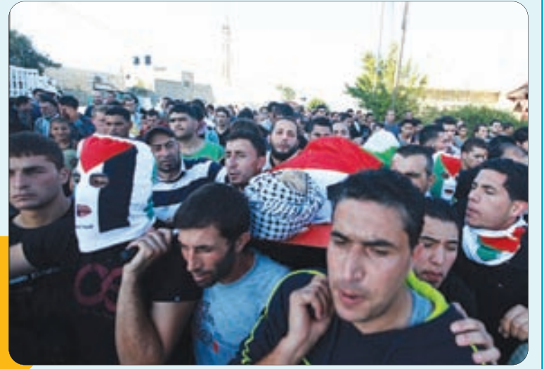
حملات اسرائیل به مناطق غیرنظامی غزه