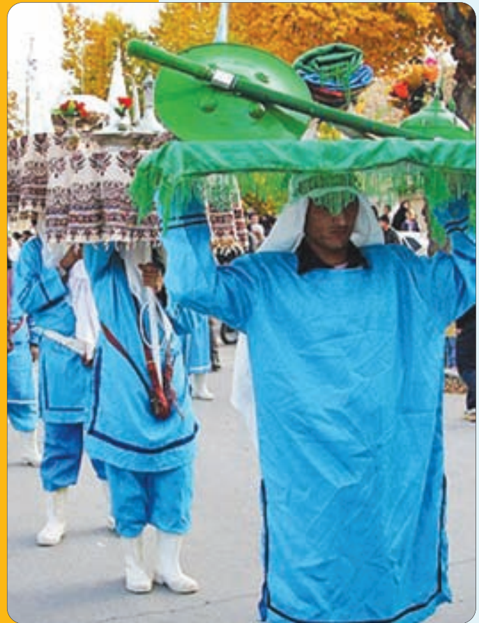
باز این چه نوحه و چه عزا و چه ماتم است