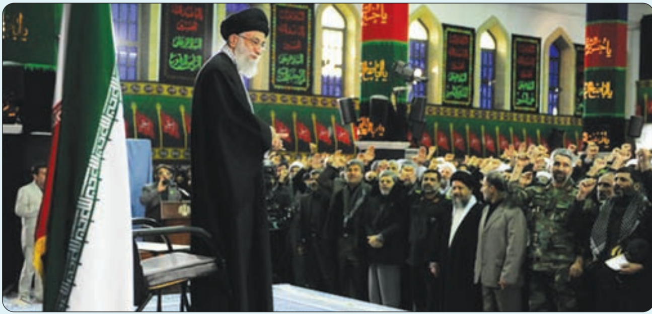
دیدار صدها نفر از بسیجیان کشور با مقام معظم رهبری