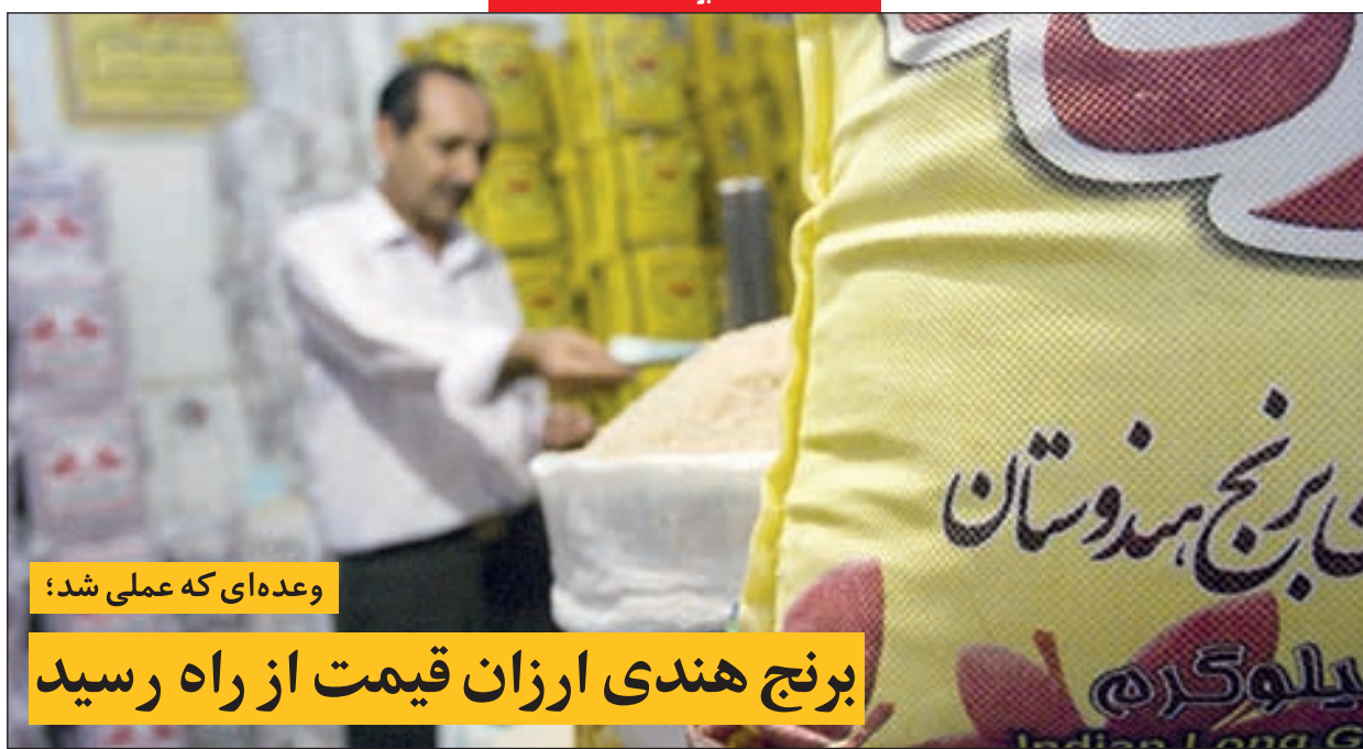
وعده‌ای که عملی شد؛