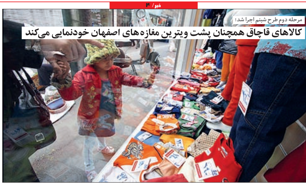
مرحله دوم طرح شبنم اجرا شد؛ کالاهای قاچاق همچنان پشت و پتوین مغازه های اصفهان خودنمایی می کند