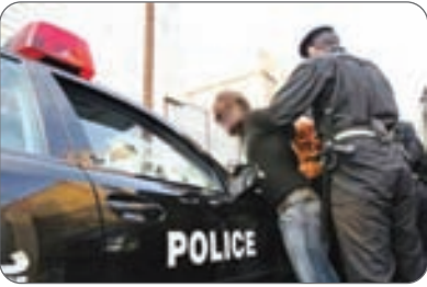
آقاخانی تصریح کرد:همچنین در پی دستگیری یک

هست و این فرماندهی با جدیت تمام در مقابل فعالیت غیرقانونی و مجرمانهٔ آنها می‌ایستد. فرمانده انتظامی استان اصفهان عنوان داشت: در همین زمینه مأموران فرماندهی انتظامی شهرستان اصفهان در عملیاتی ویژه چهار نفر از مالخرانی که اقدام به خریدن لوازم مسروقه داخل خودروهای شهروندان می‌کردند را شناسایی و دستگیر کرده و در بازرسی از مخفیگاه آنها تعداد قابل توجهی اموال، لوازم و تجهیزات مسروقه داخل خودروی مالباختگان کشف و ضبط شد.