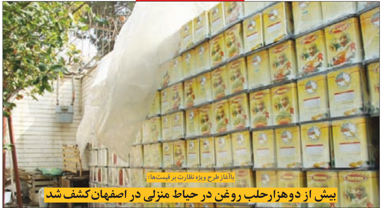
با آغاز طرح ویژه نظارت بر قیمت ها:

بیش از دوهزار حلب روغن در حیاط منزلی در اصفهان کشف شد