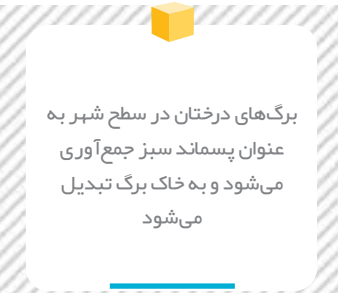
برگ‌های درختان در سطح شهر به عنوان پسماند سبز جمع‌آوری می‌شود و به خاک برگ تبدیل می‌شود

معاون خدمات شهری شهرداری اصفهان با اشاره به اهمیت مدیریت پسماند در شهر عنوان کرد: همه افرادی که در شهر زندگی می‌کنند به عنوان تولیدکنندگان پسماند‌ها باید همکاری کنند.