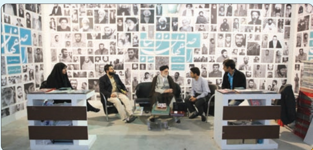
حضور پررنگ روزنامه اصفهان زیبا در نوزدهمین نمایشگاه بین المللی مطبوعات تهران