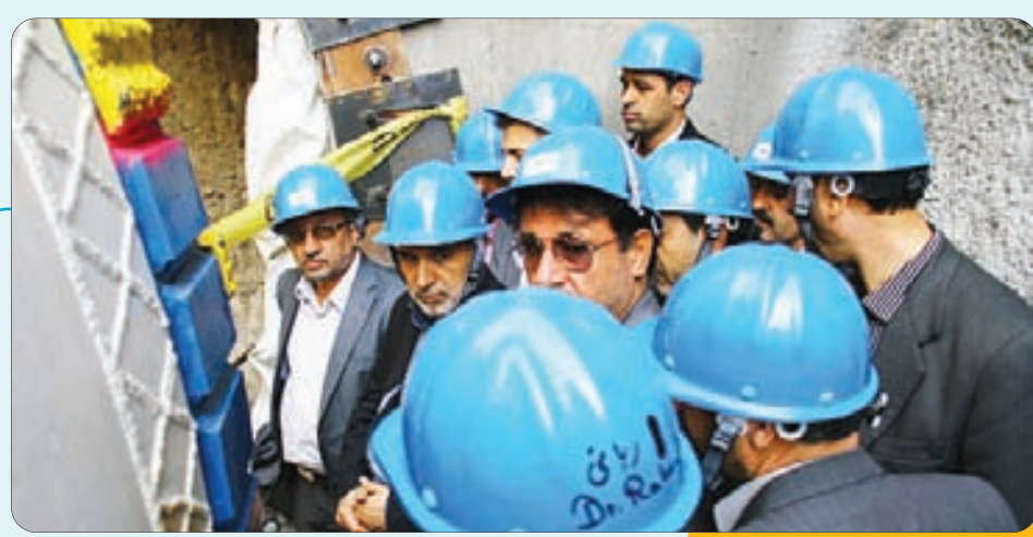
بازدید اعضای شورای اسلامی شهر از بزرگترین تونل مکانیزه تأسیسات شهری