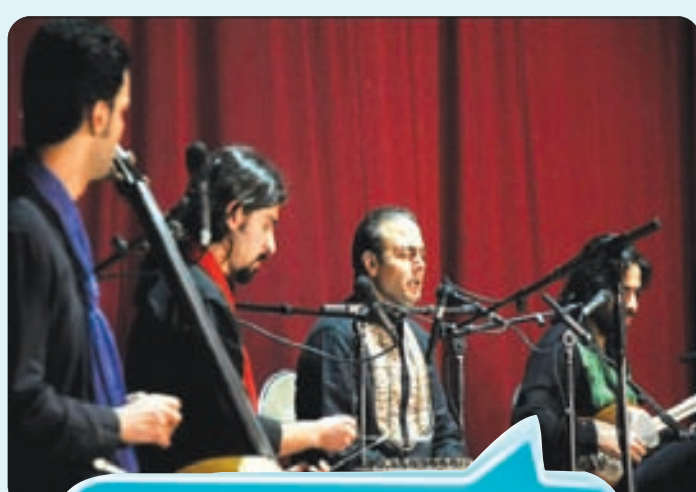
کنسرت موسیقی علیرضا قربانی در اصفهان