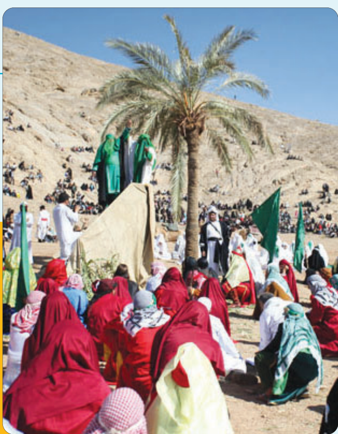
بازسازی واقعه غدیر خم در نجف آباد اصفهان