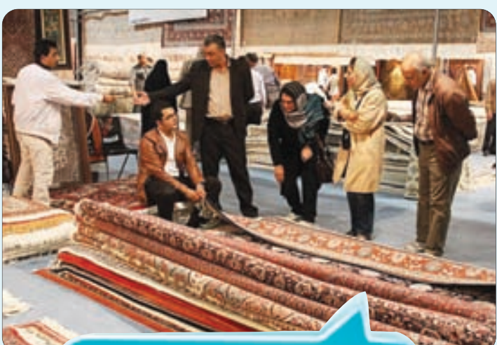
نوزدهمین نمایشگاه بین المللی فرش دستباف