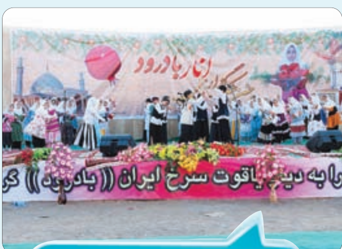
اختتامیه ششمین جشنواره انار با درود