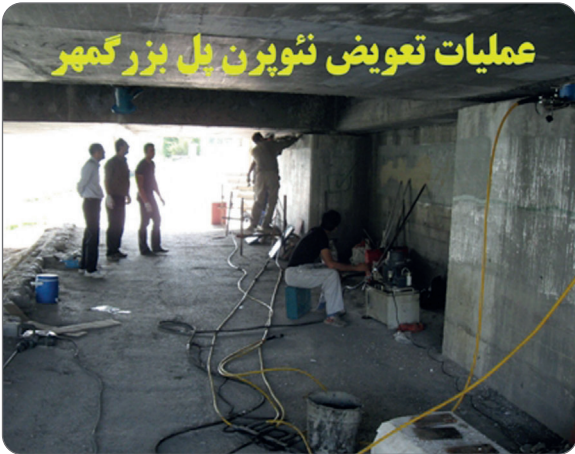
عملیات تعویض نوپن پل بزرگمهر