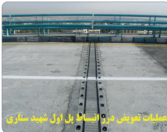
عملیات تعویض درز انبساط پل اول شهید ستاری