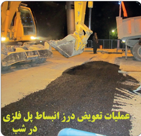
عملیات تعویض درز انبساط پل فلزی در شب