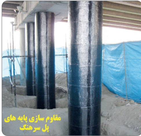
مقاوم سازی پایه های پل سرهنگ

شناسنامه فنی یک پل به طور متوسط دارای ۶۰۰ مورد از مشخصات است. از جمله مشخصات شناسنامه ای که برای یک پل ثبت میگردد: تاریخ احداث، نوع مصالح، تاریخچه ترمیم، تقویت، ایمن سازی و بهسازی و اطلاعات دیگری است که در نهایت پل را در یکی از شش وضعیت موجود قرار می دهد: وضعیت خوب، وضعیت کلی خوب، وضعیت احتیاطی، وضعیت بحرانی، وضعیت فوق بحرانی و وضعیت وخیم، که طبق نظر تیم کارشناسی، تقریباً تمامی پلهای سواره رو کلانشهر اصفهان در وضعیت خوب قرار دارند. در راستای دست یابی به این هدف، شهرداری اصفهان در سال های اخیر با صرف هزینه ای بالغ بر ۸/۲۵۶/۰۰۰/۰۰۰ ریال گام های موثری برداشته است. برخی از این اقدامات مشهود بوده و برخی از آنها از نظرها پنهان است. تعویض عرشه پل عابریپاده باغ بانوان، تعویض نوپنهای پل های شهیدچمران و پل بزرگمهر، مقاوم سازی پایه ها و درزهای انبساط پل فلزی، ترمیم و اصلاح درز انبساط پل های دفاع مقدس، مجموعه پلهای غدیر، پل شیخ صدوق، پل فردوسی، پل شهیدان امینی و پل وحید. اصلاح عیوب پل اول شهید ستاری شامل: درزهای انبساط، دیواره کوله، برش گیرها و نشست رمپ ورودی. مقاوم سازی پایه های پل سرهنگ. تعداد پل عمرانی مدرن و سواره رو در سطح کلانشهر اصفهان پل های تاریخی بروی رودخانه را شامل نمی شود.