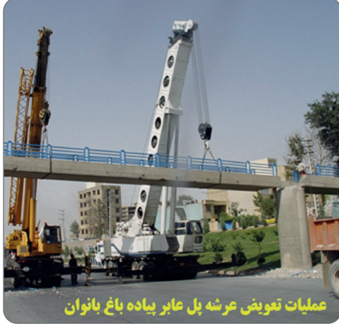
عملیات تعویض عرشه پل عابریپاده باغ بانوان