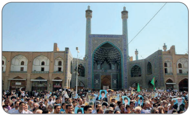
مبارزه با استکبار در سراسر کشور یک روز زودتر برگزار شد.

آیت الله طباطبائی نژاد در دومین خطبه نماز جمعه اصفهان به سالگرد سیزدهم آبان ماه و روز ملی مبارزه با استکبار جهانی پرداخت و خاطرنشان کرد: «۱۳ آبان به این دلیل به عنوان روز ملی مبارزه با استکبار جهانی نامگذاری شده است که ۳ حادثه بیادماندنی را در دل خود دارد. یکی تبعید حضرت امام خمینی (ره) به ترکیه در سال ۴۳، دیگری حمله ذخیران شاه به دانش آموزان حامی امام (ره) در سال ۵۷ و سوم، تسخیر لانه جاسوسی آمریکا توسط دانشجویان پیرو خط امام (ره) در سال ۵۸ که در هر ۳ مورد، رذایای آمریکا و استکبار جهانی به وضوح قابل مشاهده است.»