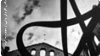
اثر رامین اعتمادی

درباره اثر رامین اعتمادی بزرگ، اولین سوال این