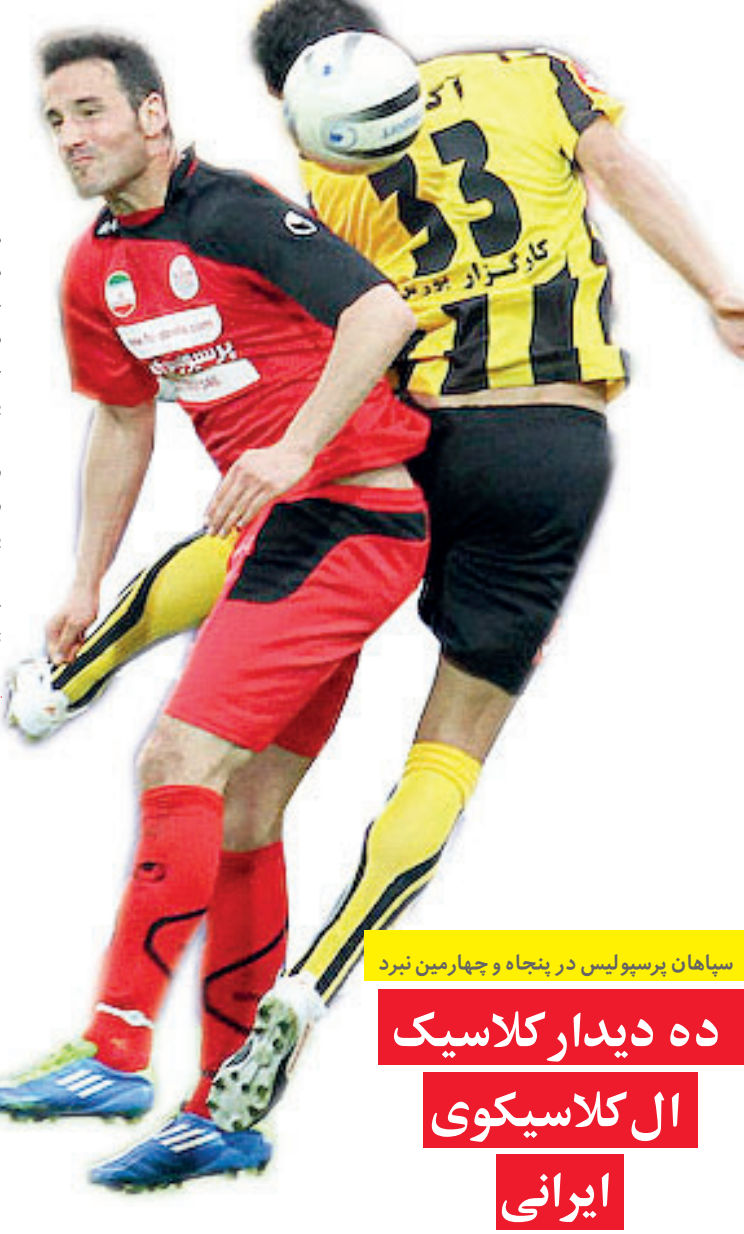
سپاهان پرسپولیس در پنجاه و چهارمین نبرد