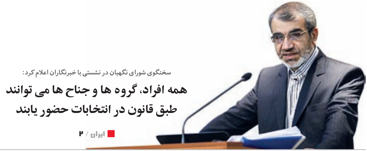
سخنگوی شورای نگهبان در نشست با خبرنگاران اعلام کرد: همه افراد، گروه‌ها و جناح‌ها می‌توانند طبق قانون در انتخابات حضور یابند