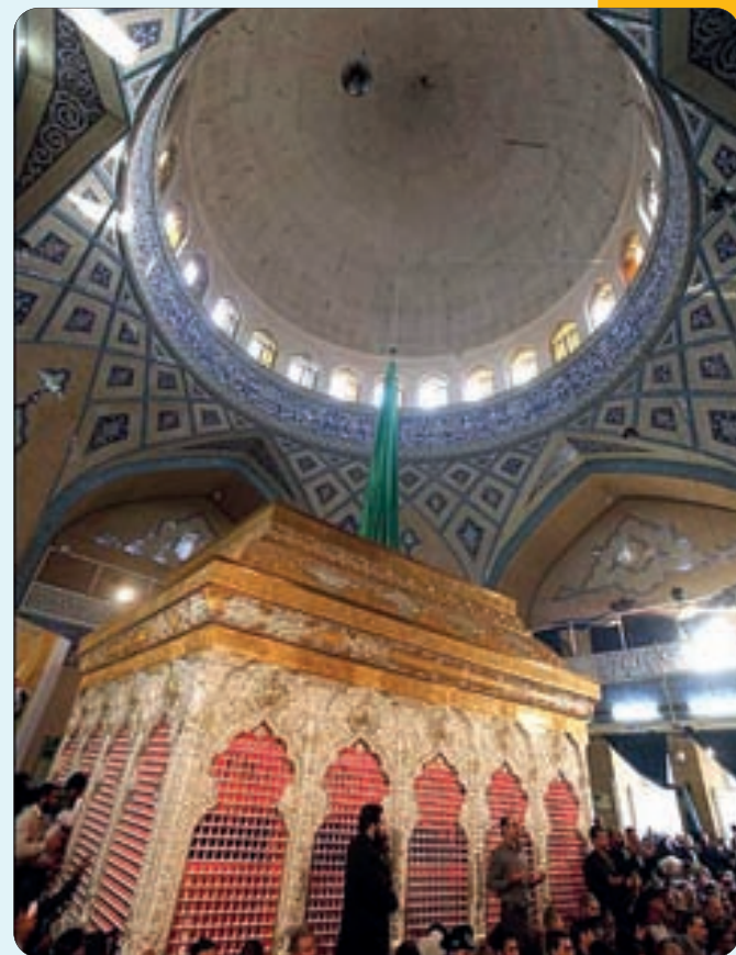
بازدید مردم از ضریح جدید امام حسین(ع)