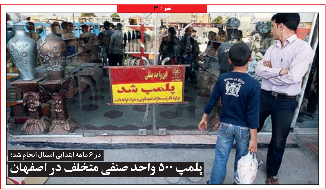
در ۶ ماهه ابتدایی امسال انجام شد؛ پلمپ ۵۰۰ واحد صنفی متخلف در اصفهان