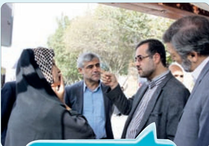
بازدید اعضای شورای شهر از روند فعالیت BRT