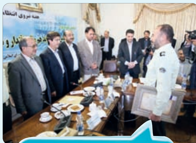
تقدیر از سخت کوشان نیروی انتظامی استان در جلسه شورای شهر