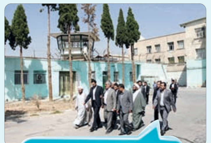
بازدید مسئولین از زندان مرکزی اصفهان