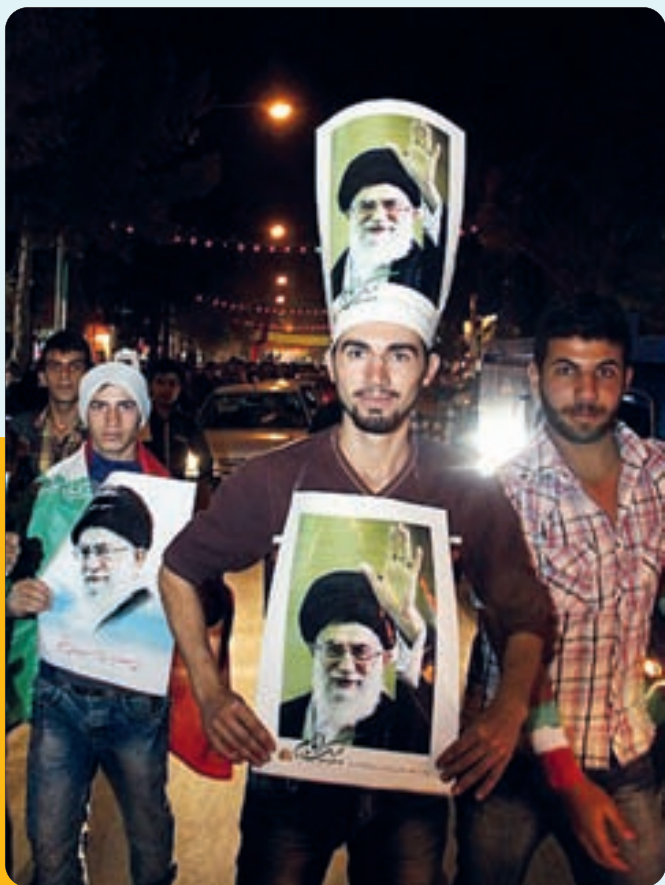
جشن شادی مردم بجنورد به مناسبت سفر مقام معظم رهبری