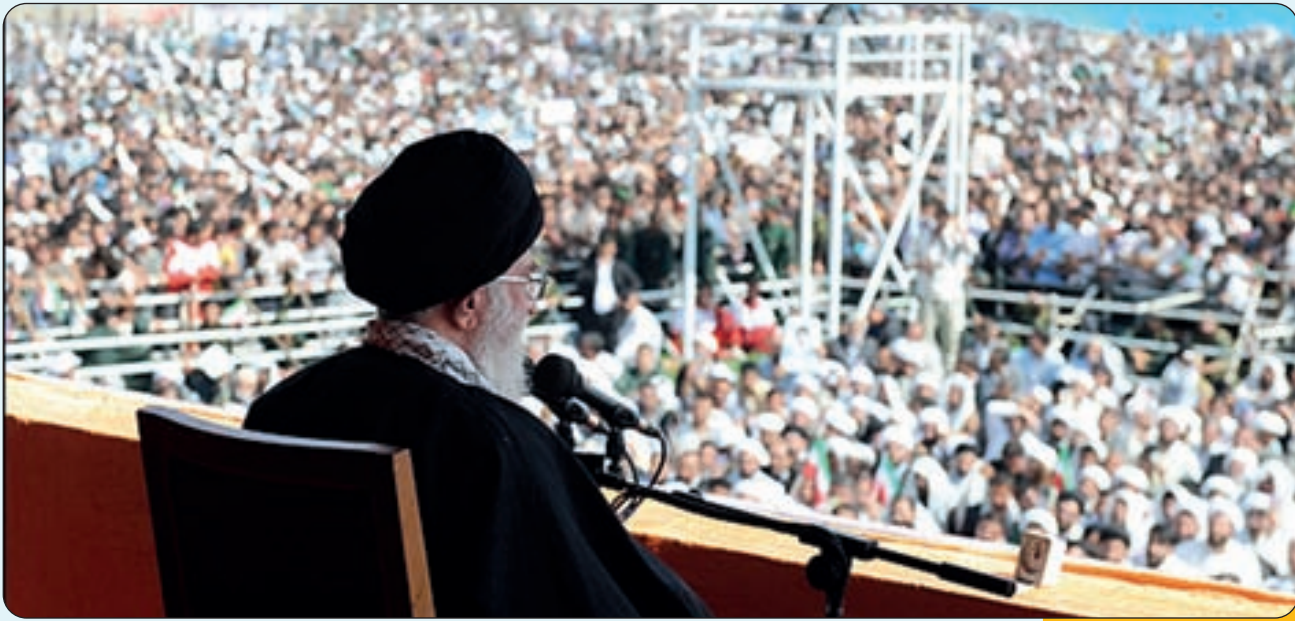
استقبال پرشور مردم بجنورد از مقام معظم رهبری