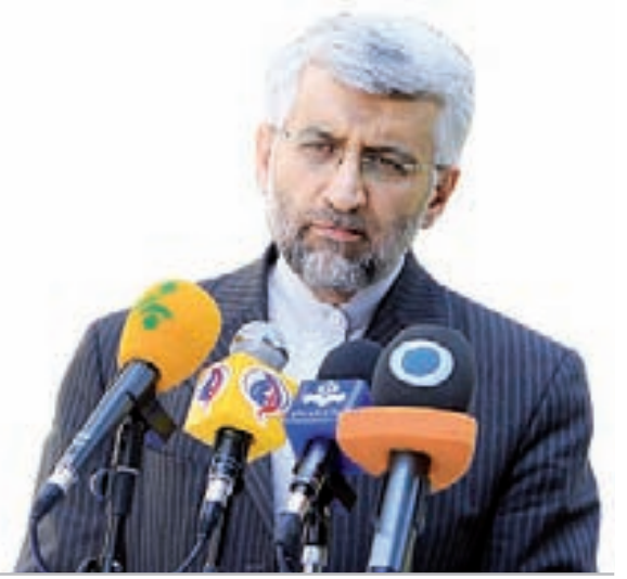
دبیر شورای عالی امنیت ملی:

ادعای آمریکا در خصوص طرح موسوم به ۹ گام ایران کذب است