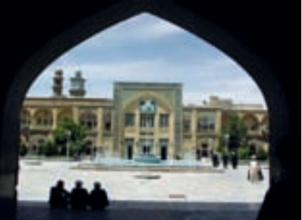
نمایی از منزل آیت‌اله حائری یزدی