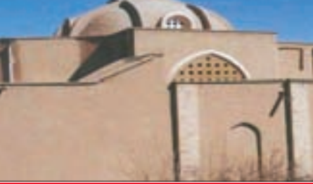
نمایی از منزل آیت‌اله حائری یزدی

می‌افکند. بدین ترتیب آیت‌الله حائری همراه با بسیاری از شاگردانش از جمله امام خمینی که در آن هنگام بیست‌ساله بود، رهسپار قم شد.