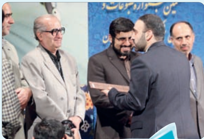
کسب رتبه برتر روزنامه اصفهان زیبا در بین مطبوعات و رسانه های استان