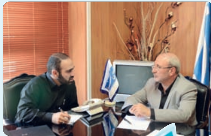
حضور نماینده مردم شاهین شهر، برخوردار و میمه در در روزنامه اصفهان زیبا