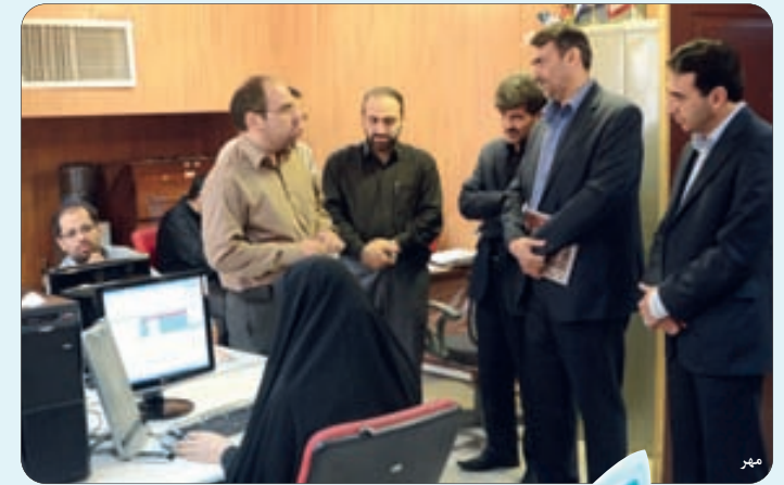
حضور شهردار منطقه یازده در روزنامه اصفهان زیبا