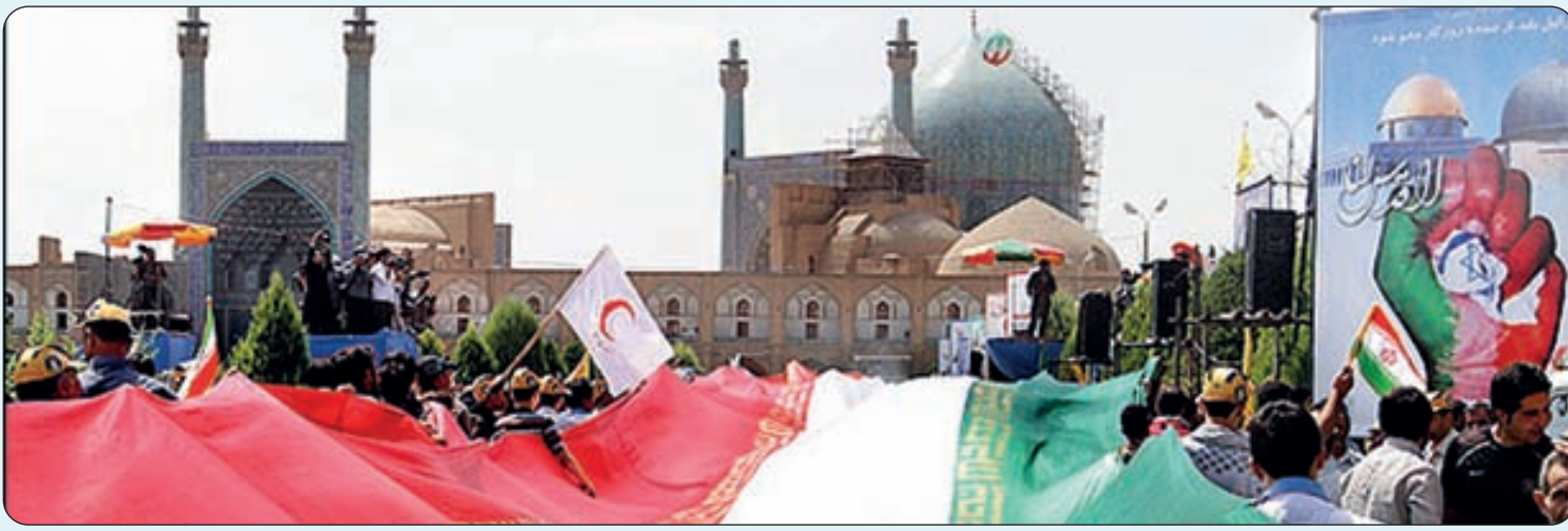
حضور گسترده مردم در راهپیمایی روز قدس و برگزاری باشکوه نماز عید فطر در اصفهان