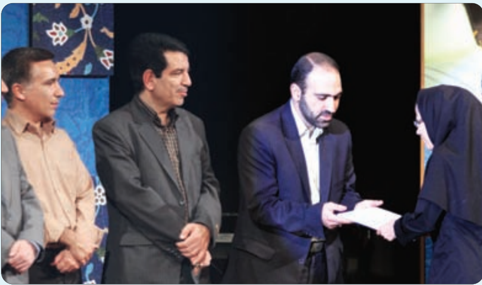
درخشش چشمگیر روزنامه اصفهان زیبا در هفتمین جشنواره مطبوعات و خبرگزاری های استان اصفهان