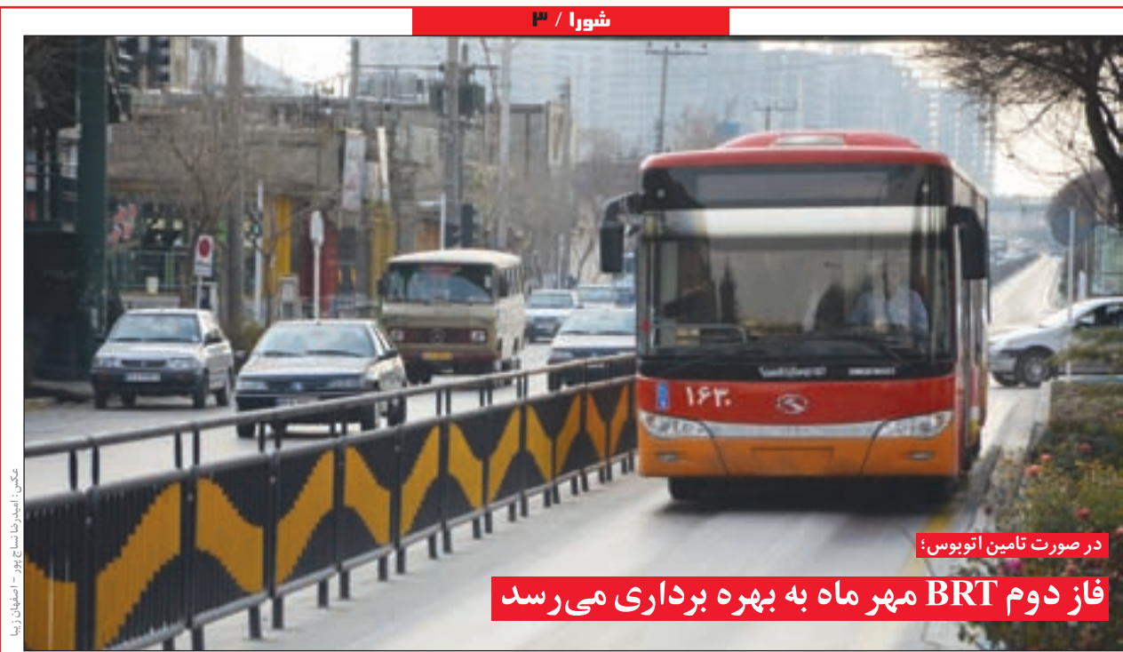
در صورت تأمین اتوبوس: فاز دوم BRT مهر ماه به بهره‌برداری می‌رسد