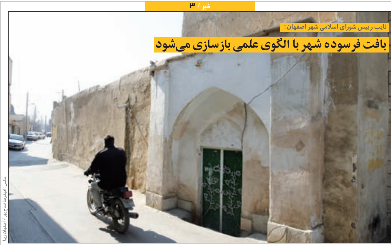
نایب رئیس شورای اسلامی شهر اصفهان:

بافت فرسوده شهر با الگوی علمی بازسازی می‌شود