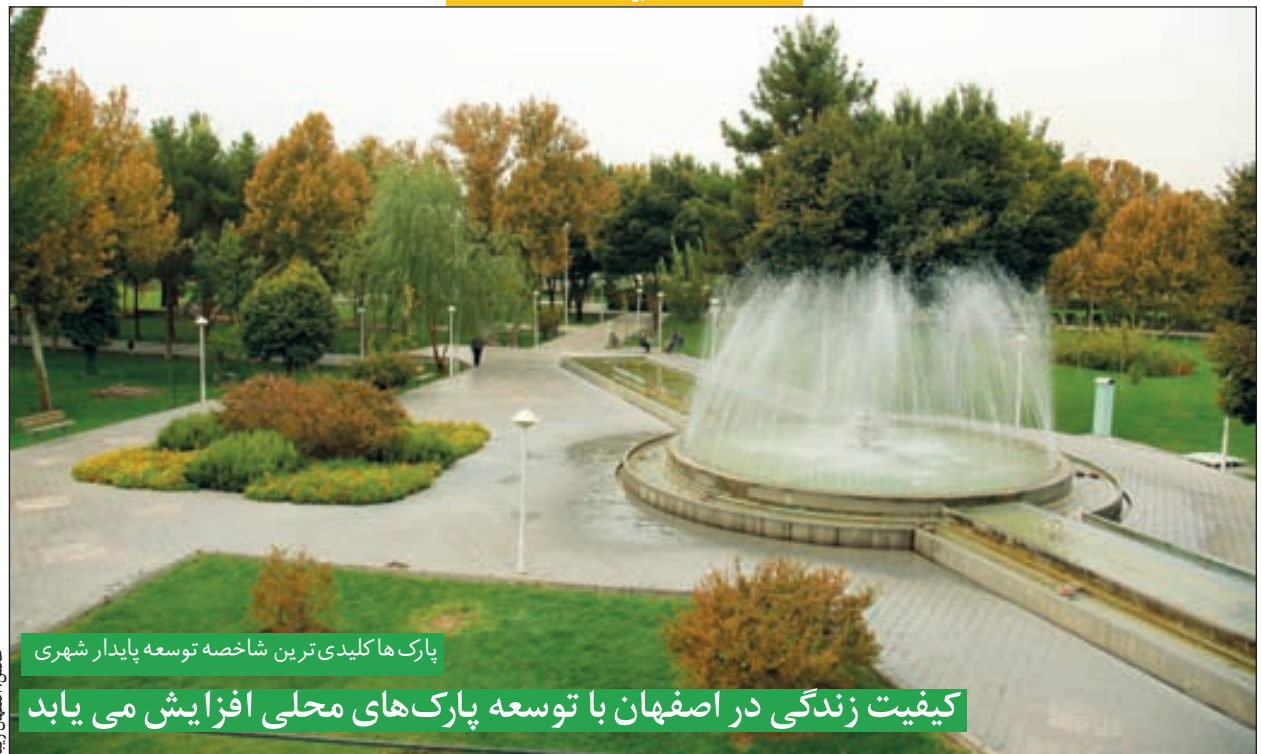
پارک‌ها کلیدی‌ترین شاخصه توسعه پایدار شهری

کیفیت زندگی در اصفهان با توسعه پارک‌های محلی افزایش می‌یابد