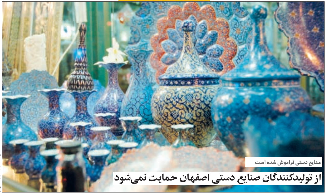
صنایع دستی فراموش شده است

از تولیدکنندگان صنایع دستی اصفهان حمایت نمی شود