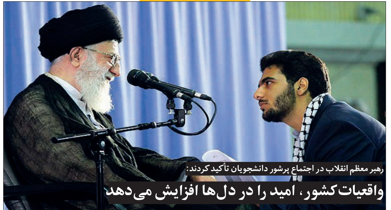
رهبر معظم انقلاب در اجتماع پرشور دانشجویان تأکید کردند:

واقعیات کشور، امید را در دل‌ها افزایش می‌دهد