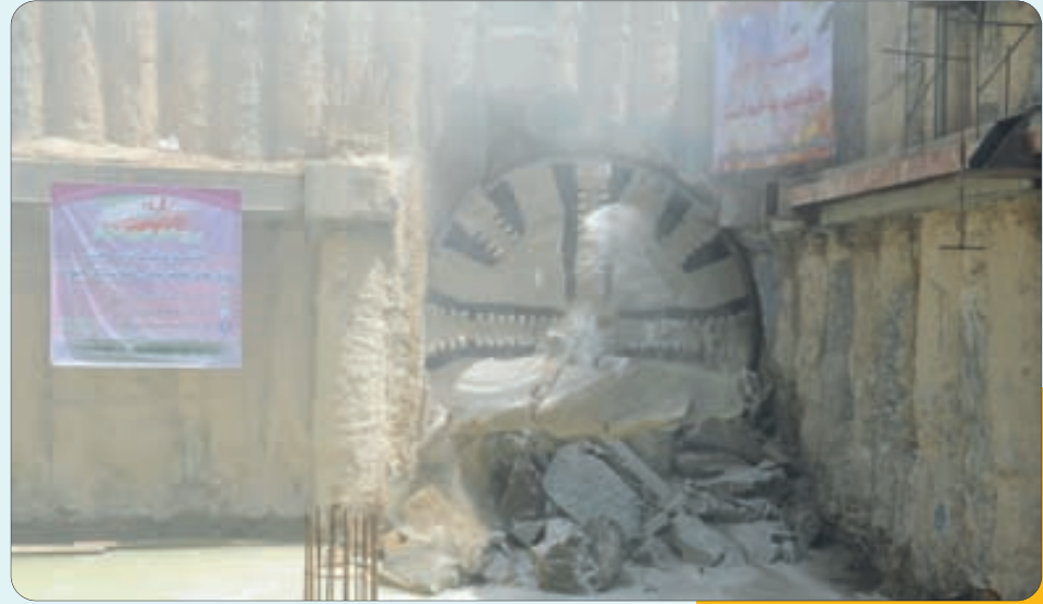
پایان عملیات حفاری خط یک مترو اصفهان