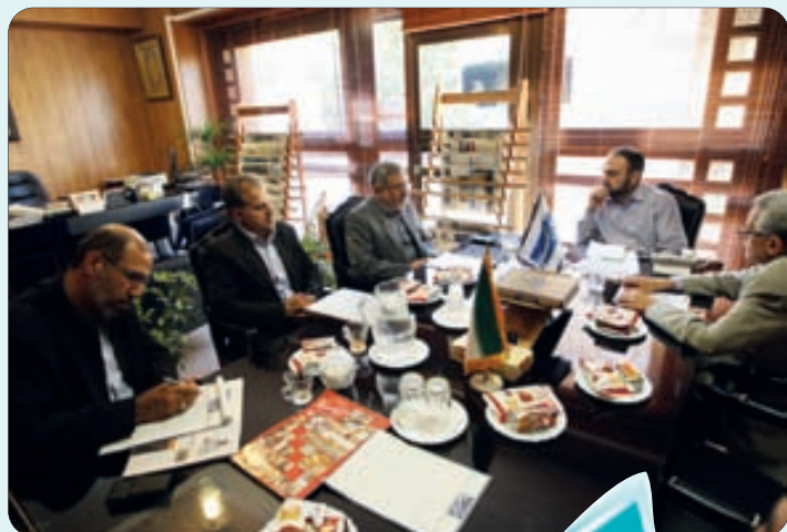
حضور مسئولان دانشگاه آزاد خوارسگان و معاونت سما در روزنامه اصفهان زیبا