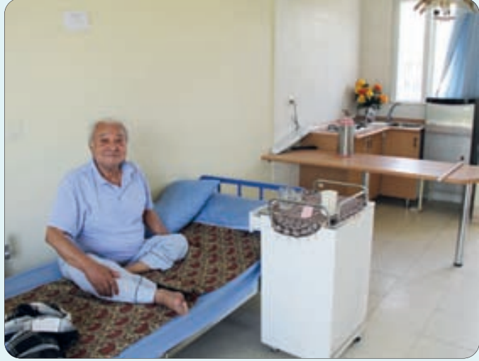
خانه جدید سالمندان / خانه شهروندان ارشد (به همت خیرین)