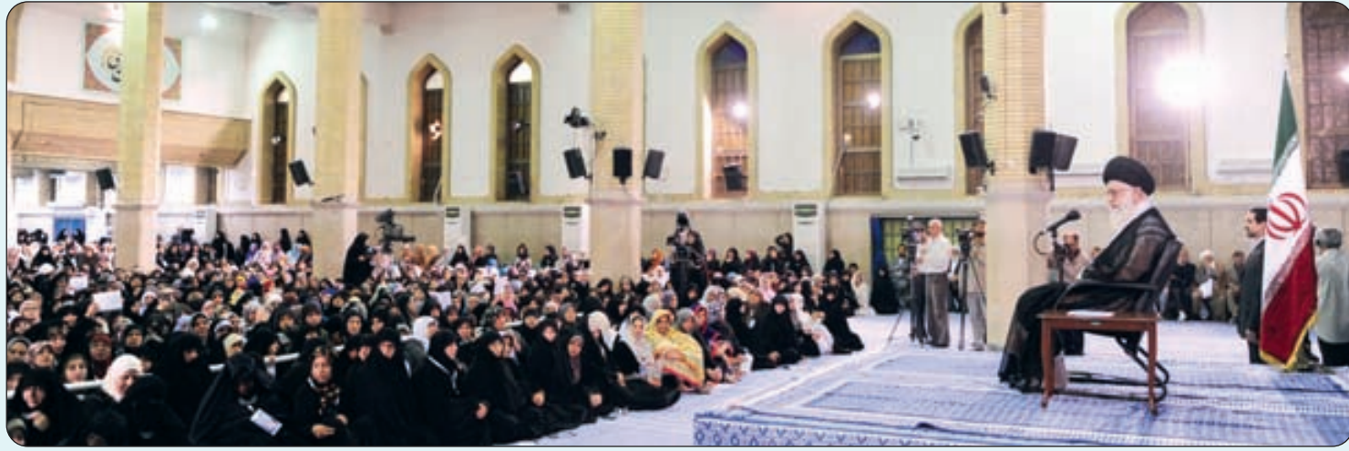
دیدار شرکت کنندگان اجلاس زنان و بیداری اسلامی با رهبر معظم انقلاب