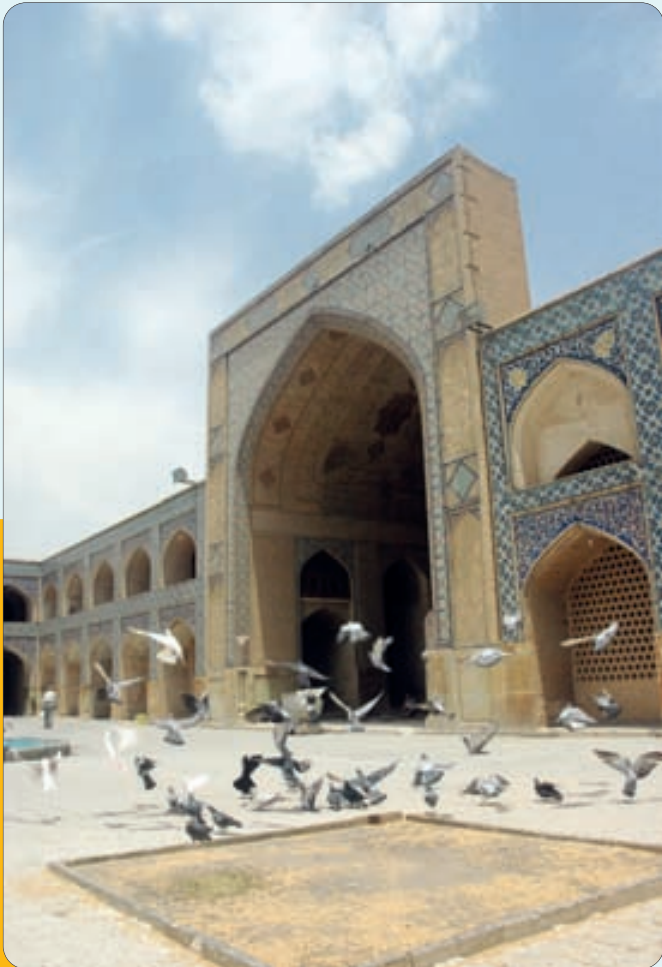
پس از سالها انتظار مسجد جامع عتیق اصفهان ثبت جهانی شد