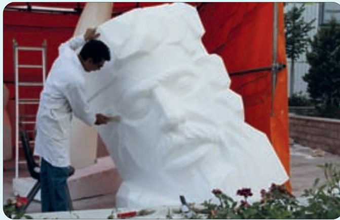
نمایشگاه میلان و خدمات شهری در اصفهان