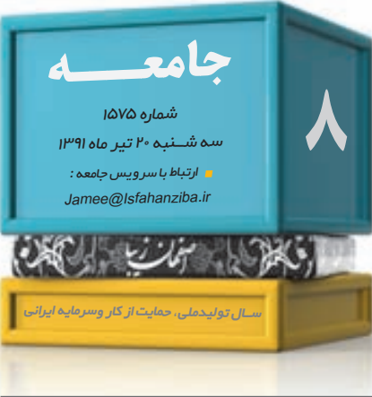
سال تولیدمطبی: حمایت از کار و سرمایه ایرانی