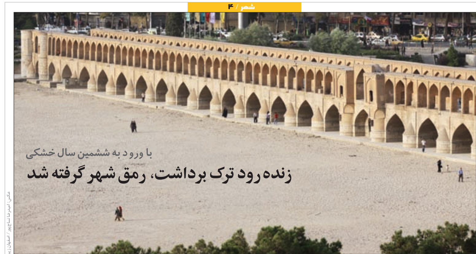
با ورود به ششمین سال خشکی زنده رود ترک برداشت، رمق شهر گرفته شد

وجود بیش از یک میلیون و ۸۰۰ هزار نفر جمعیت و معضلاتی که در گسترش شهر وجود دارد از سویی و فراوانی خرده فرهنگ‌های متفاوت در سطح کلانشهر اصفهان از سوی دیگر باعث شد تا شورای اسلامی شهر لزوم مطالعات الگوهای سبک زندگی را در تمامی مناطق چهارده‌گانه شهری به تصویب برساند.