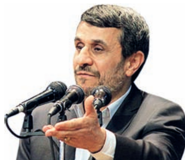
احمدی نژاد در اصفهان:

تولید ۲۱ میلیون تن فولاد مصرفی کشور باید در ایران انجام گیرد