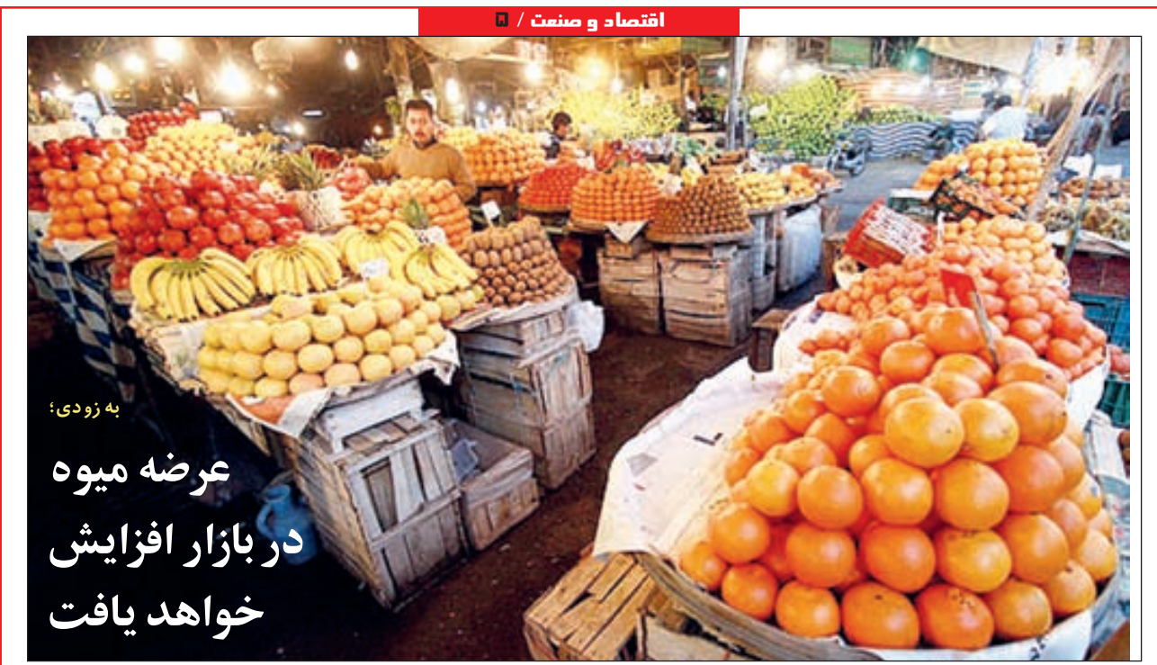
به زودی: عرضه میوه در بازار افزایش خواهد یافت

اکتون در بسیاری از شهرهای جهان بر ساخت و سازها در شهر نظارت می‌شود و اصلی‌ترین نقش نظارتی را شهرداری‌ها بر عهده دارند. یکی از قدیمی‌ترین قوانین مربوط به کنترل ساخت و ساز، لوح حمورابی است. در بخشی از این طرح نوشته شده است «اگر ساختمانی فروریزد و یکی از ساکنان ساختمان کشته شود، سازنده ساختمان باید به قتل رسد.» در ایران اولین بار در سال ۱۳۳۴ در ذیل بند ۲۴ ماده ۵۵ قانون شهرداری‌ها، صدور پروانه ساختمانی در شهرها بر عهده این نهاد قرار گرفت و در سال ۱۳۴۵ پس از تصویب قانون «اصلاح پاره‌ای از مواد و الحاق چند ماده به قانون شهرداری‌ها»، صدور پروانه ساختمانی در محدوده قانونی و حریم شهرها، بر عهده شهرداری گذاشته شد.