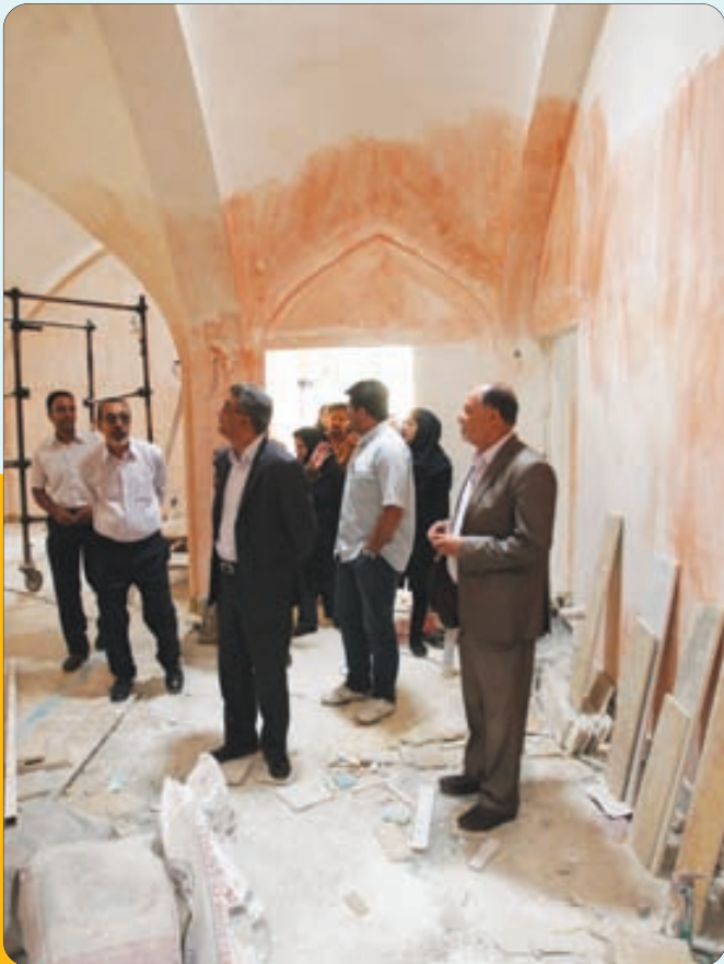
بازدید خبرنگاران از پروژه‌های منطقه سه