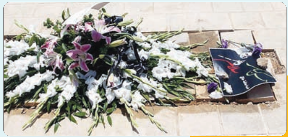
وداع با اسطوره موسیقی ایران و جهان