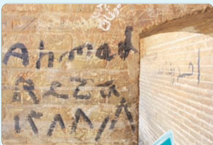
نمونه‌ای از توجه شهروندان به آثار باستانی!