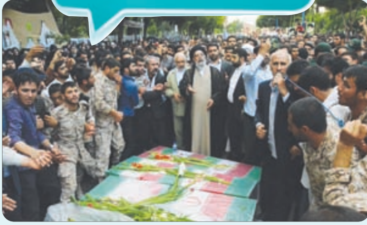
تشییع پیکر شهدای دفاع مقدس در اصفهان