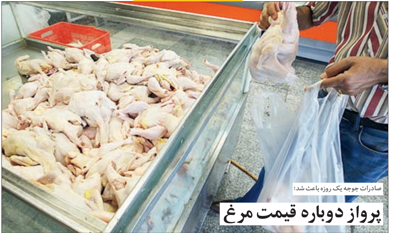
صادرات جوجه یک روزه باعث شد؛