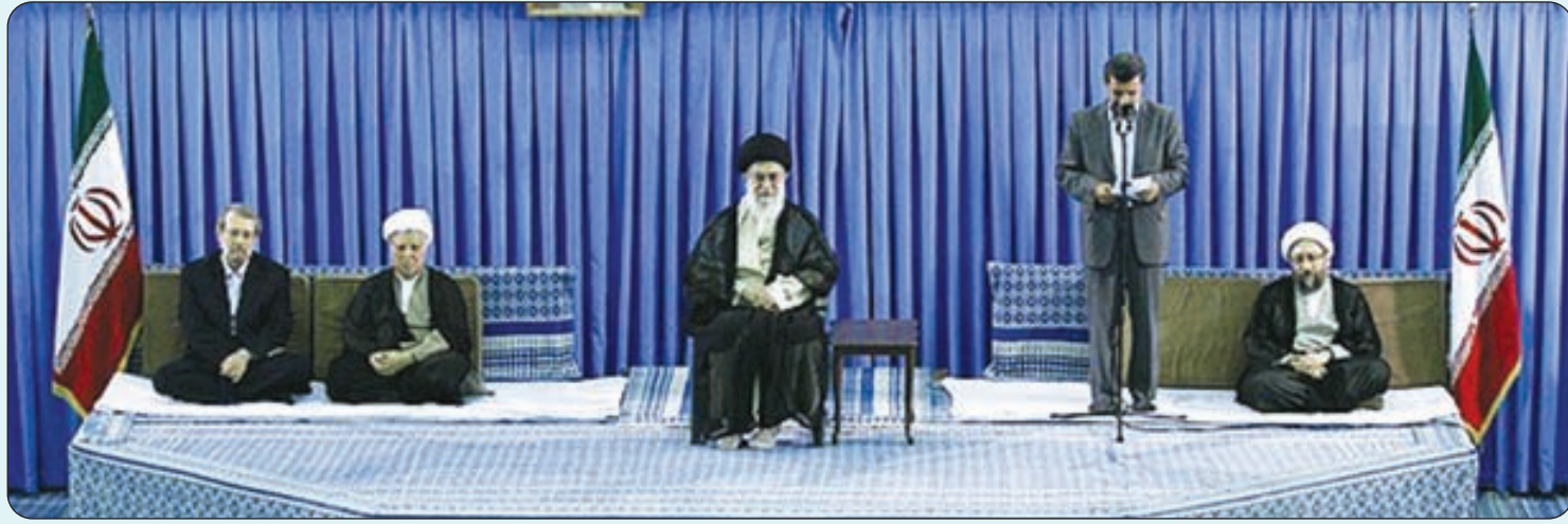
دیدار مسوولین نظام و سفیرای کشورهای اسلامی با مقام معظم رهبری