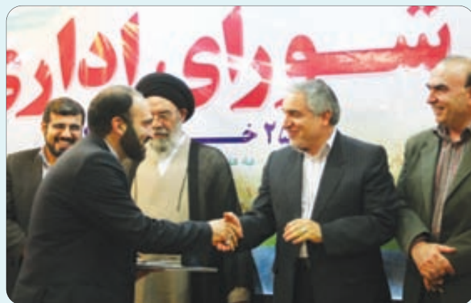
جلسه شورای اداری استان - انتخاب روزنامه اصفهان زیبا به عنوان رسانه برتر استان در موضوع انتخابات