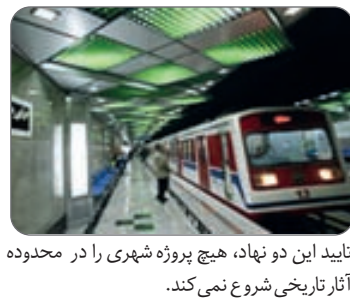
تایید این دو نهاد، هیچ پروژه شهری را در محدوده آثار تاریخی شروع نمی‌کند.