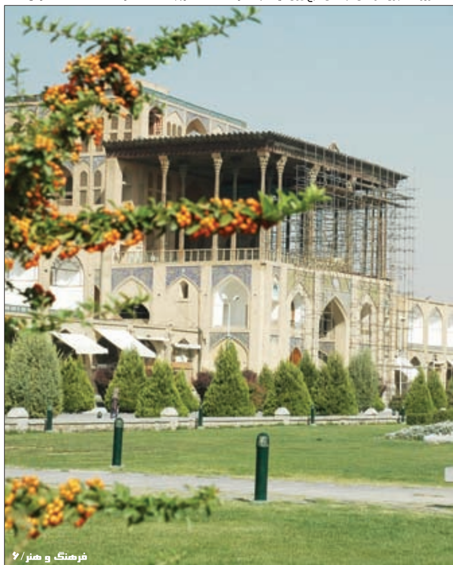
فرهنگ و هنر / ۶

چشم و چراغ میدان امام(ره) هم چنان گرفتار دار بست هاست