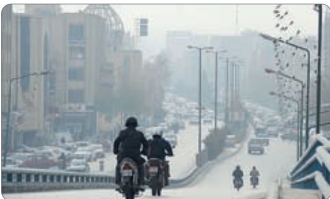
گروه شهر: آسمان خاکستری شهر اصفهان. گرد و غبار در شهر اصفهان به مرز هشدار رسید و شهروندان اصفهانی قربانیان اصلی شیخون آلاینده ها هستند.