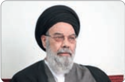
گزارش زهره یعقوبی

طرح شجره صالحین بر دشمن شناسی تأکید کرد و گفت‌شناخت روش‌ها مهم‌ترین راه مقابله با دشمن است.