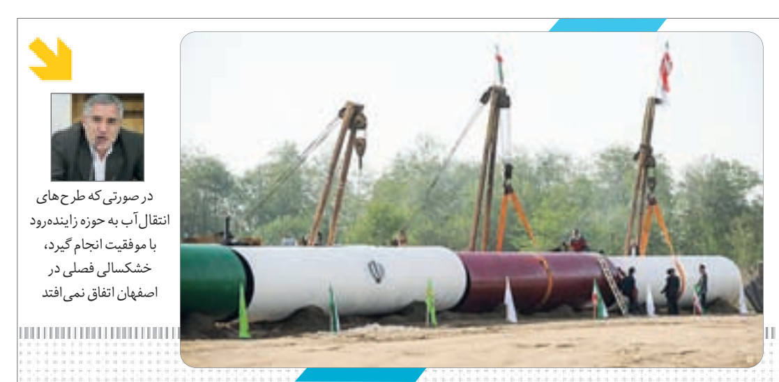
خبر اول گروه استان