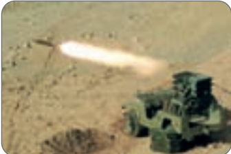
گزارش گروه استان

خرمشهررزمایش بیت المقدس ۲۴آمادگی یگان های رزمی ارتش را ارتقا بخشیده ودرمنطقه نصرآباد اصفهان به نمایش می‌گذارد. معاون سیاسی و امنیتی استاندار اصفهان با اشاره به اهمیت گرامیداشت سالروز آزادسازی خرمشهر اعلام کرد: برنامه‌های این روز از چند هفته قبل با تشکیل ستادی ویژه پیش‌بینی شده که مسوولیت اجرای آن با بنیاد حفظ آثار و ارزش‌های دفاع مقدس و دیگر اعضا این ستاد می‌باشد.