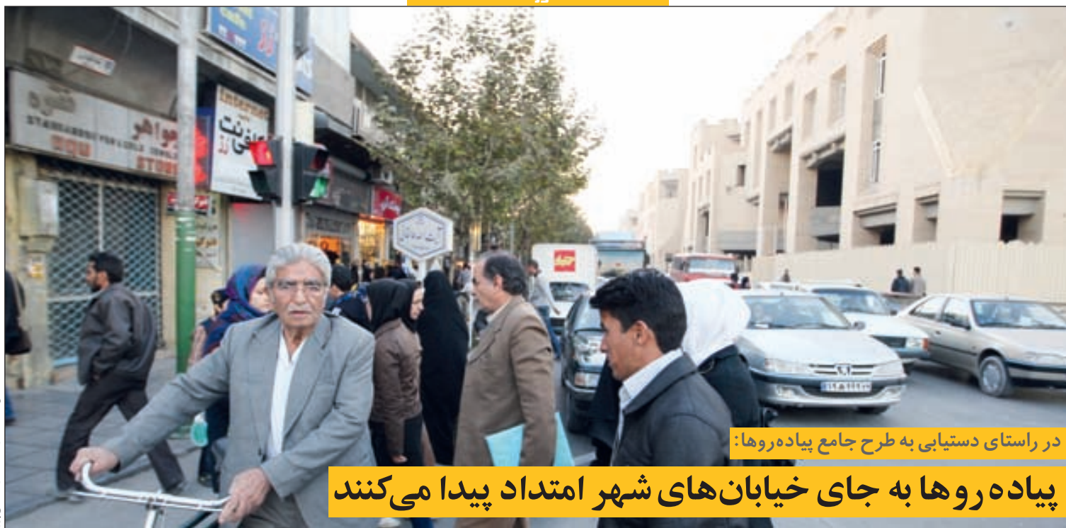
در راستای دستیابی به طرح جامع پیاده‌روها: