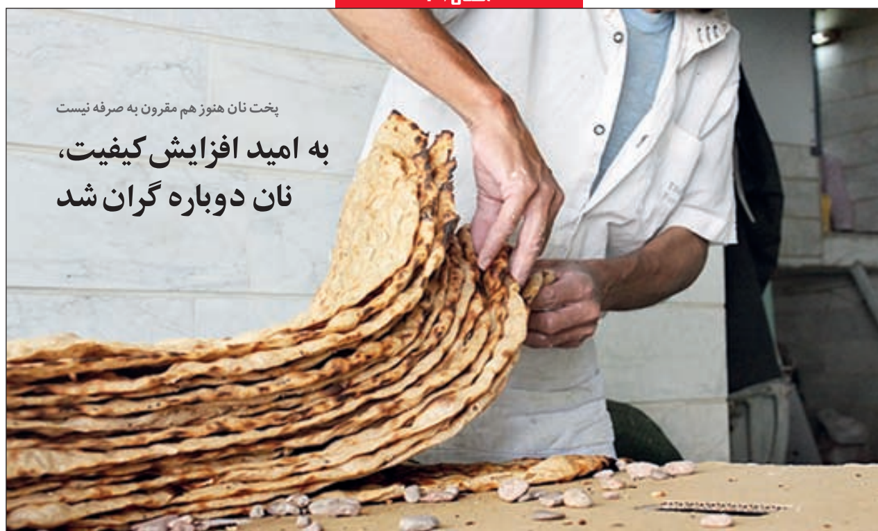
پخت نان هنوز هم مقرون به صرفه نیست به امید افزایش کیفیت، نان دوباره گران شد