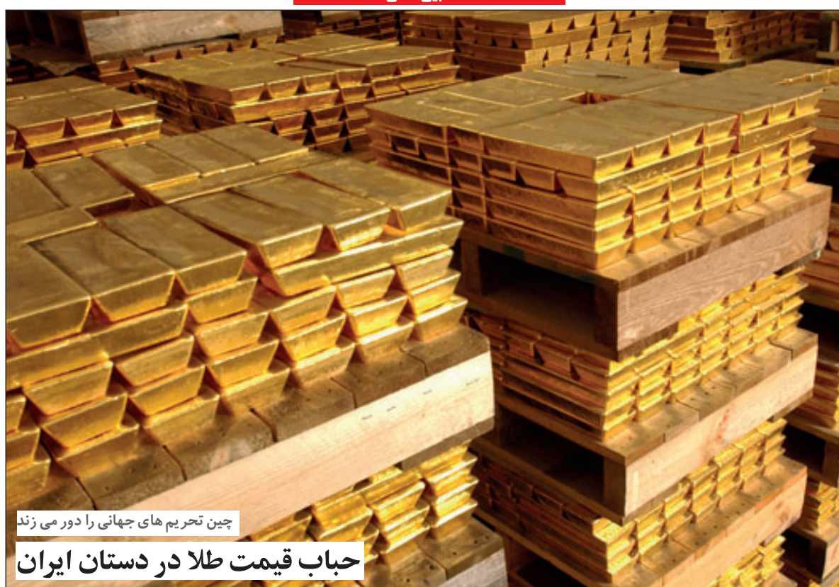
چین تحریم های جهانی را دور می زند