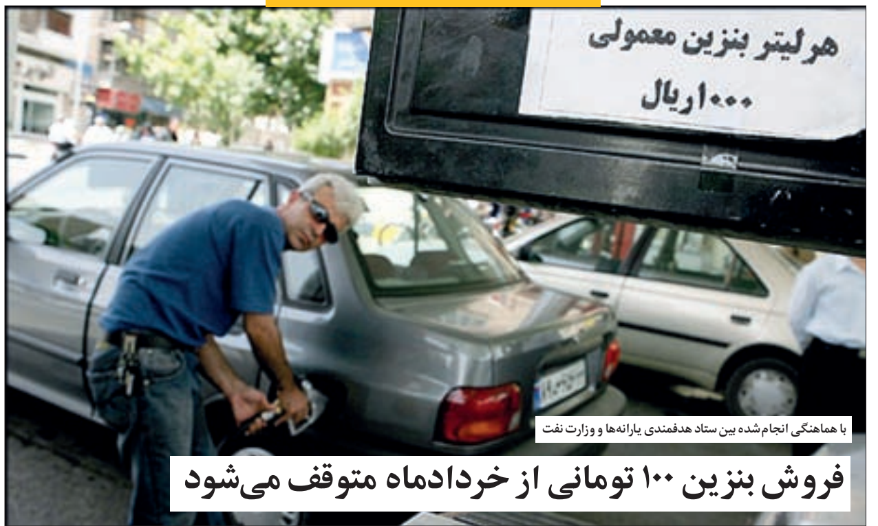
با هماهنگی انجام شده بین ستاد هدفمندی یارانه‌ها و وزارت نفت

فروش بنزین ۱۰۰ تومانی از خردادماه متوقف می‌شود