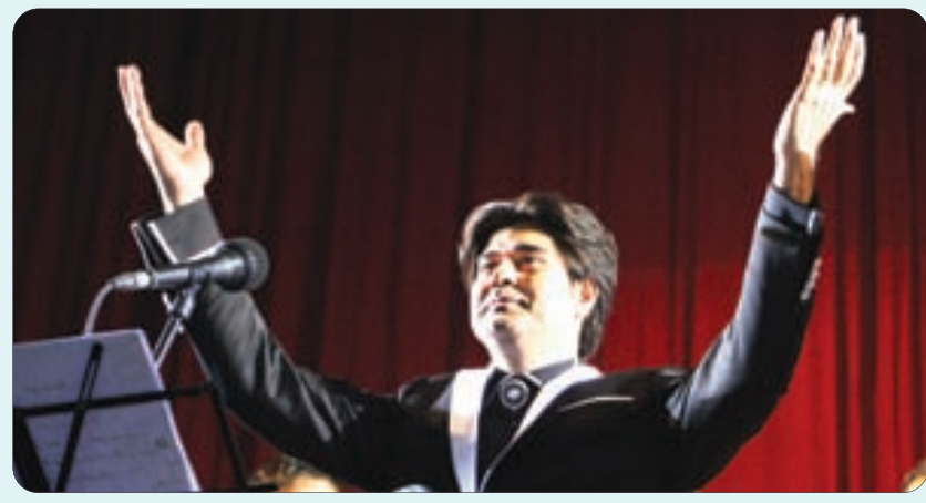
اجرای کنسرت سالار عقیلی در اصفهان