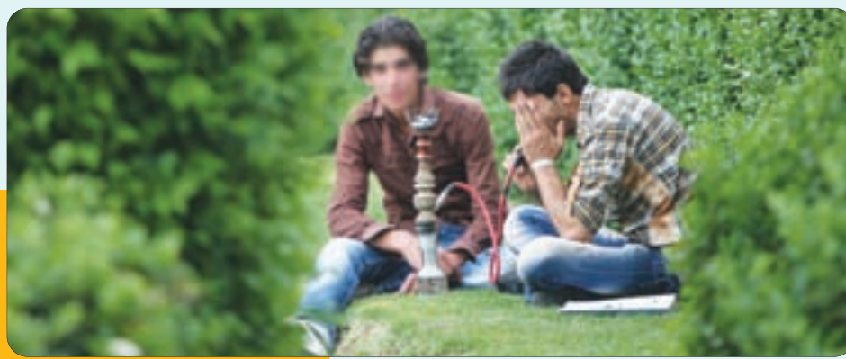
تفریحات سالم جوانان در حاشیه زاینده رود!!!