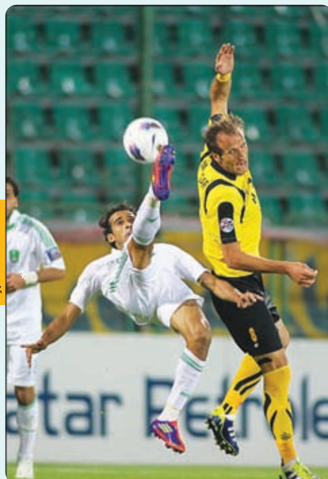
بردهای پی در پی سیاهان در لیگ های مختلف