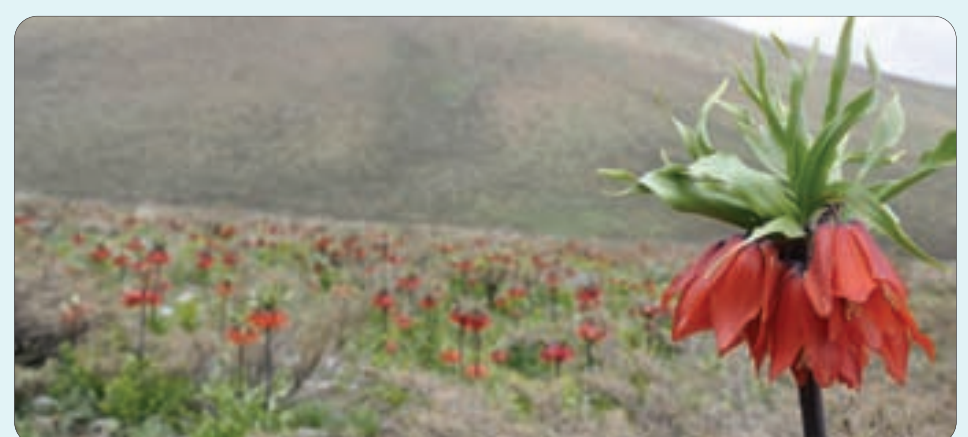
دشت لاله های واژگون / گلستان گوه