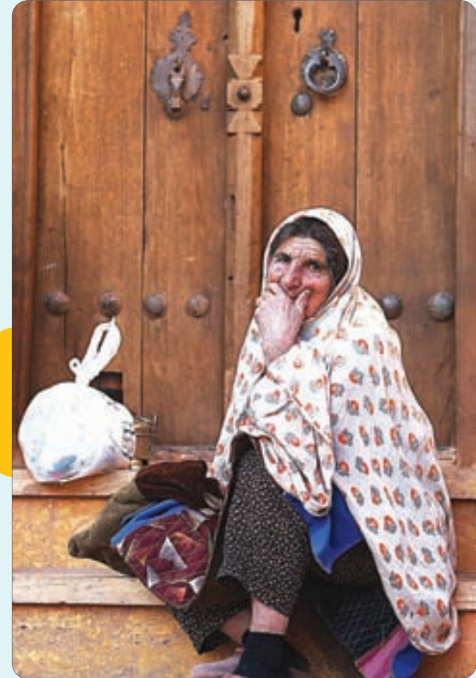
پوشش محلی روستای ابیانه