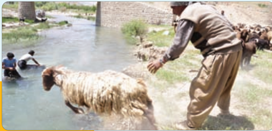
استحمام گوسفندان در روستاهای نزدیک به سمیرم