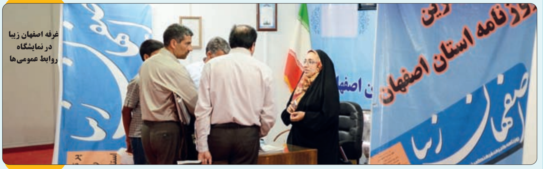
غرفه اصفهان زیبا در نمایشگاه روابط عمومی ها