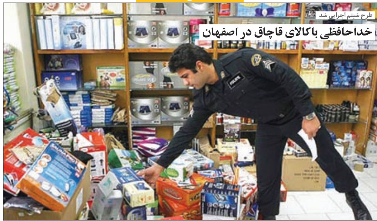
طرح ششم اجرایی شد