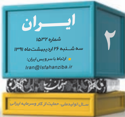
سال نویدمدنی، حمایت از کار و سرمایه ایران