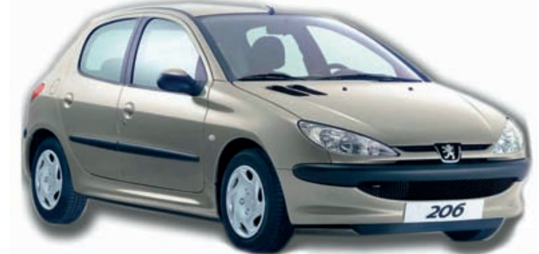
خبر فوری گروه اقتصاد

ایران خودرو در واکنش به خبر توقف تولید پژو ۲۰۶ از حدود یک هفته پیش اعلام کرد: از ۱۴ فروردین ۹ هزار دستگاه پژو ۲۰۶ تولید و روانه بازار شده است. ایران خودرو اضافه کرد: در سال تولید ملی مانند سه سال گذشته، افزایش خودکفایی قطعات خودروهای تولیدی ایران خودرو در دستور کار قرار گرفته است و این روند با جدیت دنبال می شود. بر کرد: خط تولید هیچ خودرویی در گروه صنعتی ایران خودرو متوقف نشده و تولید طبق برنامه پیش بینی شده ادامه دارد و از ۱۴ فروردین ماه سال جاری بیش از ۹ هزار دستگاه خانواده پژو ۲۰۶ تولید و روانه بازار شده است. ایران خودرو اضافه کرد: در سال تولید ملی مانند سه سال گذشته، افزایش خودکفایی قطعات خودروهای تولیدی ایران خودرو در دستور کار قرار گرفته است و این روند با جدیت دنبال می شود. بر