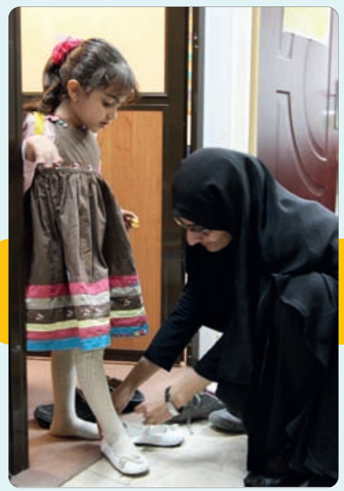
همسر و فرزند شهید رضایی نژاد