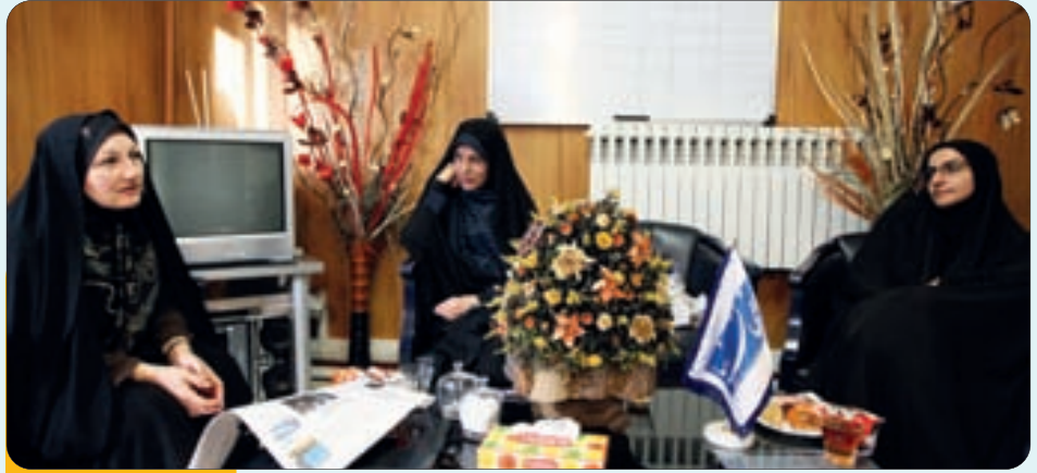
مصاحبه اختصاصی روزنامه اصفهان زیبا با همسران شهدای هسته‌ای