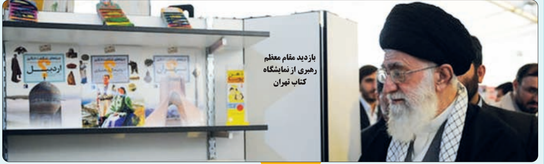
بازدید مقام معظم رهبری از نمایشگاه کتاب تهران