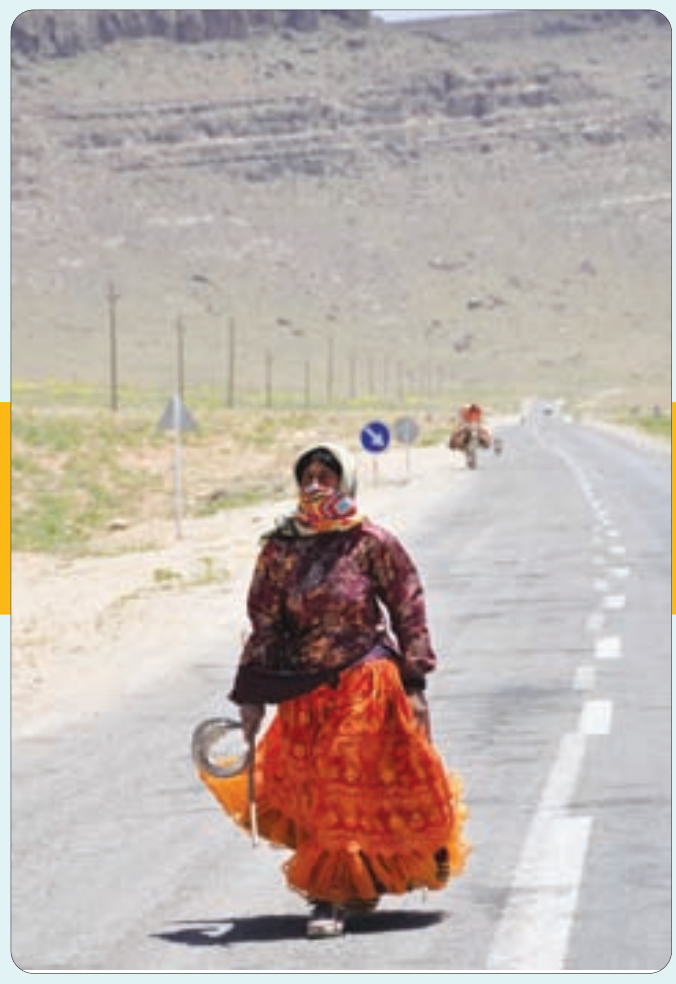
کوچ عشایر در حاشیه سمیرم