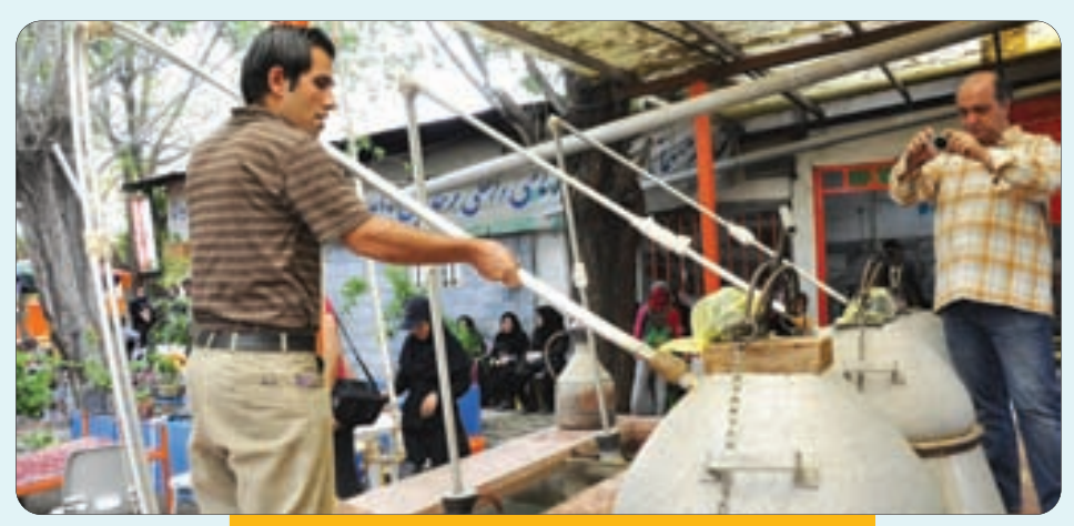
آغاز گلابگیری در گاشان