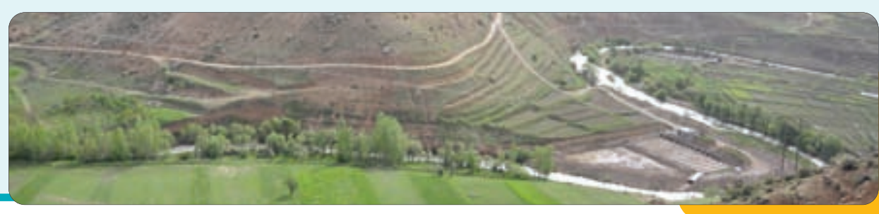
طبیعت زیبای دره عشق در حوالی چهارمحال و بختیاری