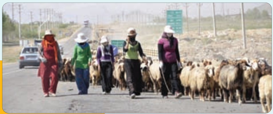
کوچ عشایر در حوالی یاسوج