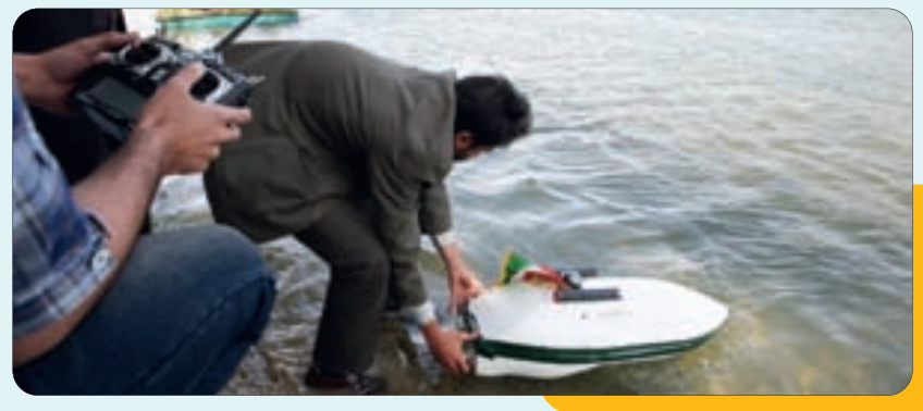
رونمایی از شناور منحصر به فرد با قابلیت پرتاب موشک