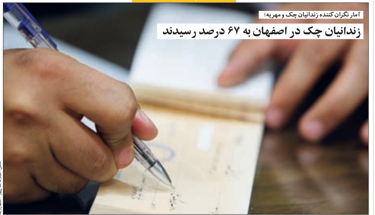
آمار نگران کننده زندانیان چک و مهریه؛