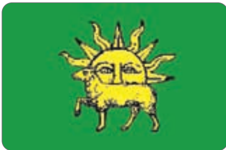
پرچم شاه طهماسب