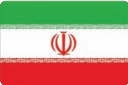
پرچم جمهوری اسلامی با آرم الله