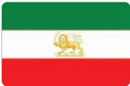
آخرین نشان شیر و خورشید در تاریخ ایران بر پرچم پهلوی نقش بست