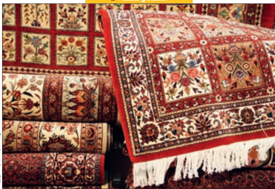
مسوولان تصمیم گیر چاره ای بیندیشند؛

مراقب باشید صنعت فرش دستباف به قهقرا نرود!