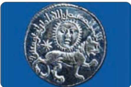
برای اولین بار شیر و خورشید در سکه سلجوقی به وسال رسیدند

شیخ انصاری (و نیز شیخ مرتضی انصاری) (زادهٔ ۱۲۱۴. در ذوقل و درگذشتهٔ ۱۲۸۱. نجف) با نام کامل شیخ مرتضی بن محمد امین انصاری در ذوقلی از علمای شیعه قرن ۱۳ قمری است.