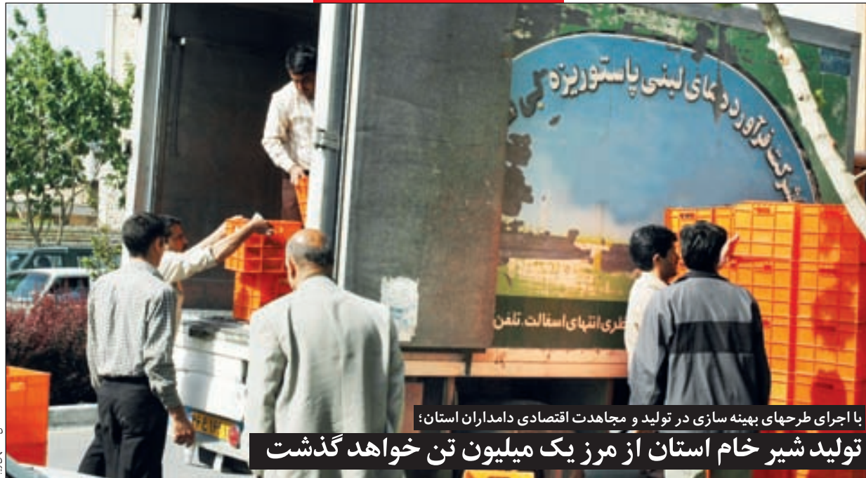
با اجرای طرح‌های بهینه‌سازی در تولید و مجاهدت اقتصادی دامداران استان؛ تولید شیر خام استان از مرز یک میلیون تن خواهد گذشت