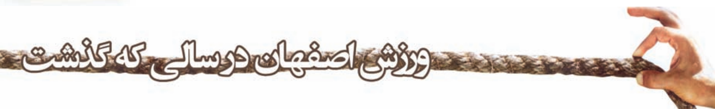
گروه ورزش - مهری مصور

کتاب ورزش اصفهان در سال ۹۱ نیز با همه خوشی ها و ناخوشی ها بسته شد. سال پایان یافته هر چند که پر بار خاصی را برای ورزش اصفهان به دنبال نداشت اما از حیث سوزهای خبری نسبتاً پر بار بود. در آخرین چاپ سال ۹۱ پرونده ویژه ای را برای ورزش اصفهان تدارک دیدیم.