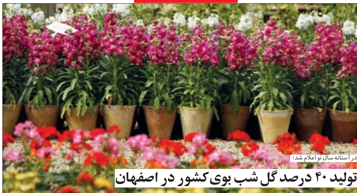
در آستانه سال نو اعلام شد؛