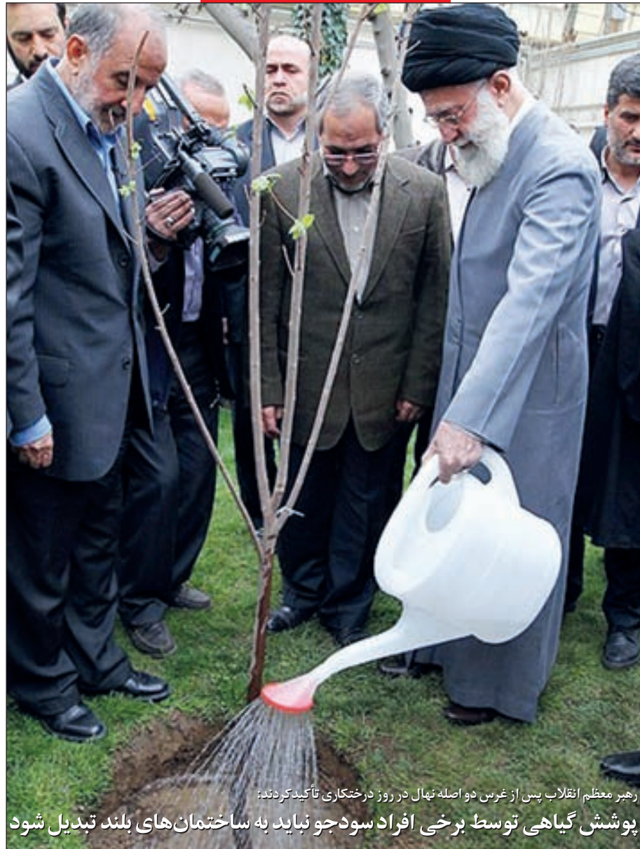
رهبر معظم انقلاب پس از غرس دو اصله نهال در روز درختکاری تأکید کردند: پوشش گیاهی توسط برخی افراد سوذو نباید به ساختمان‌های بلند تبدیل شود