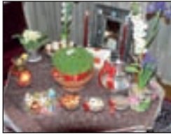
تاریخ ۱۲ اسفند، آموزش پخت شیرینی های نوروزی در ۱۷ اسفندماه و کلاس آموزش سفزه هفت سین در تاریخ ۲۱ و ۲۳ اسفند کرده است.

علاقه مندان می توانند جهت ثبت نام به خانه فرهنگ دشتستان واقع در خیابان سروش خیابان دشتستان جنب پارک مطهری مراجعه کرده و جهت کسب اطلاعات بیشتر با شماره تلفن ۲۹۳۹۲۳ تماس حاصل فرمایند