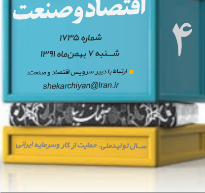
سبک زندگی، حمایت از کار و سرمایه ایرانیا