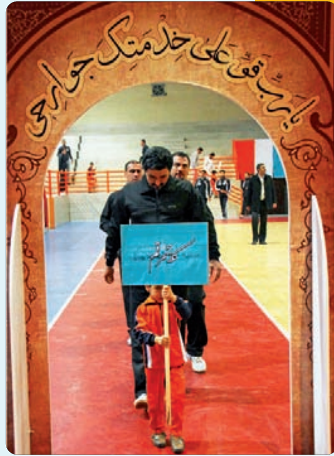
افتتاح مسابقات والیبال کارکنان شهرداری های کلان شهرهای کشور در اصفهان