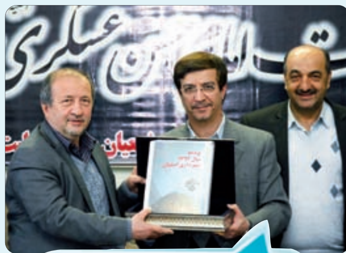
تقدیم لایحه بودجه سال ۹۲ شهرداری به شورای اسلامی شهر