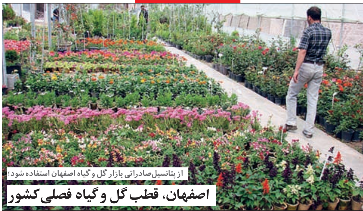
از پتانسیل صادراتی بازار گل و گیاه اصفهان استفاده شود؛ اصفهان، قطب گل و گیاه فصلی کشور

با هدف کاهش التهاب روانی بازار انجام می‌شود؛ عرضه مستقیم برنج خارجی در بازار اصفهان