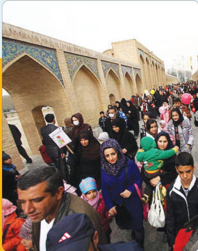
مانور هوای پاک در اصفهان