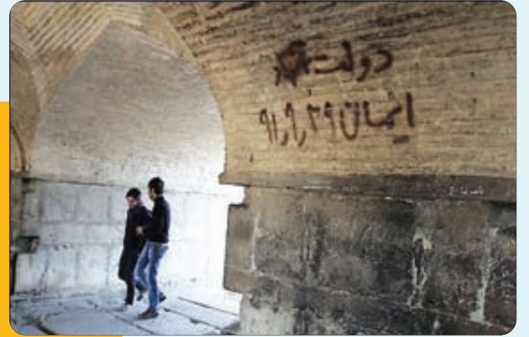
عدم رسیدگی مسوولین به آثار تاریخی شهر (پل خواجو)