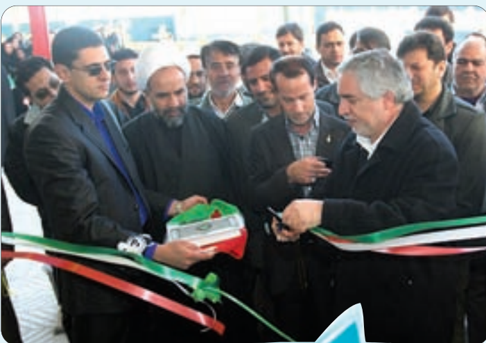
افتتاح طرح های عمرانی در شهرستان لنجان با حضور استاندار