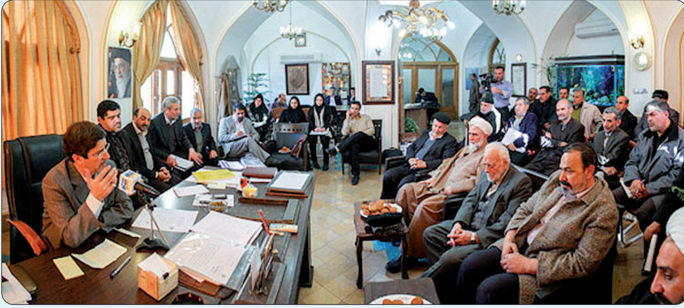
ملاقات مردمی شهردار اصفهان با شهروندان منطقه یک