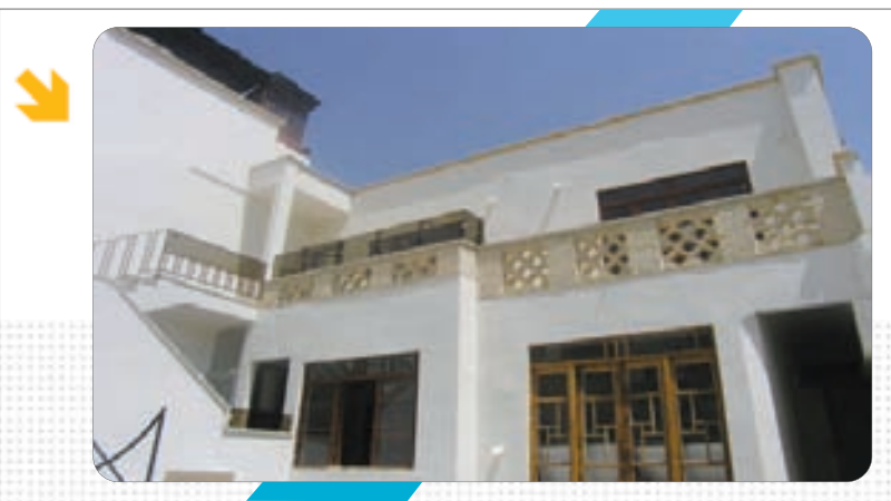
گزارش ایلیا یزدانی

خانه شهید آیت الله دکتر محمد حسینی بهشتی در خیابان شهید بهشتی و کوچهای به همین نام واقع شده و با توجه به سبک معماری اش از آثار دوره پهلوی است. این خانه که ۲۲۰ متر مربع مساحت دارد در ۲ آشکوب ساخته شده است. حیاط آن مستطیلی شکل طراحی شده است و مجموعه فضاهای این خانه در دو قسمت شمال و جنوب حیاط مستطیلی واقع شده است. طبقه بالای این خانه دارای تالاری وسیع و اتاقی در کنار آن است.