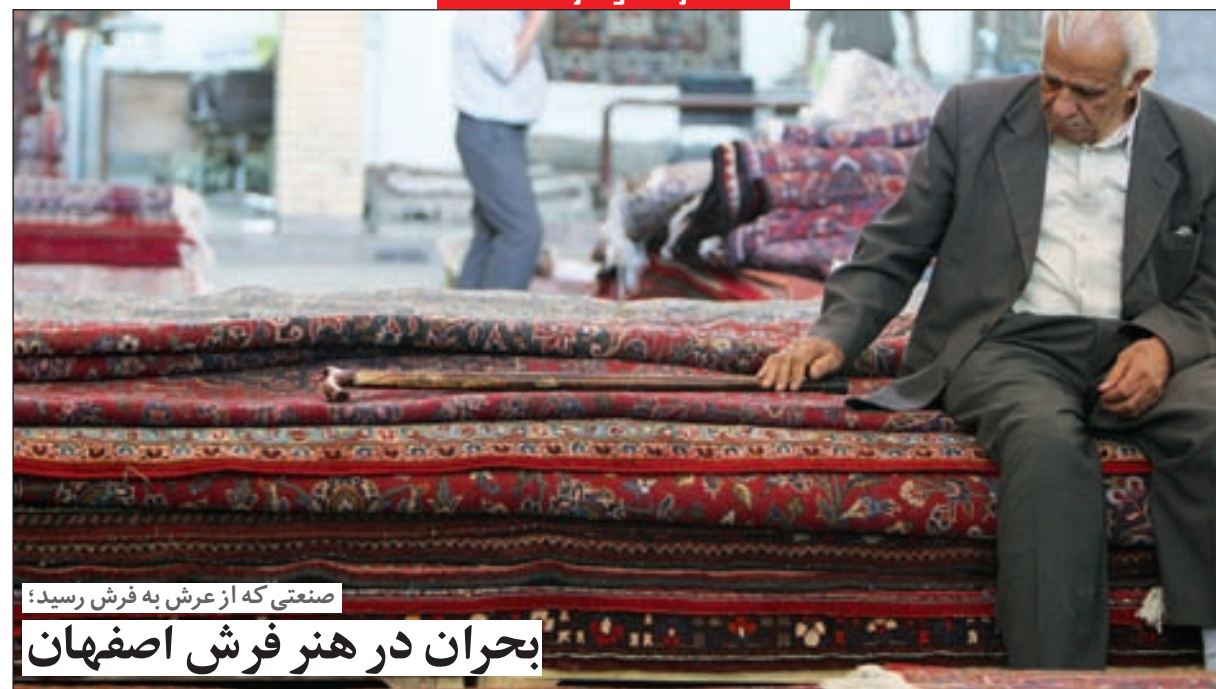
صنعتی که از عرش به فرش رسید؛ بحران در هنر فرش اصفهان