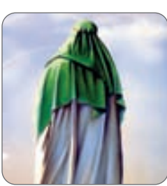
بیست و یکم