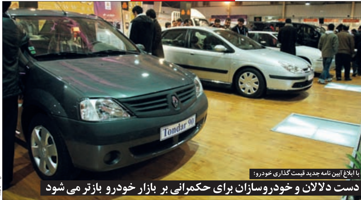
با ابلاغ آیین نامه جدید قیمت گذاری خودرو؛ دست دلالان و خودروسازان برای حکمرانی بر بازار خودرو بازتر می شود