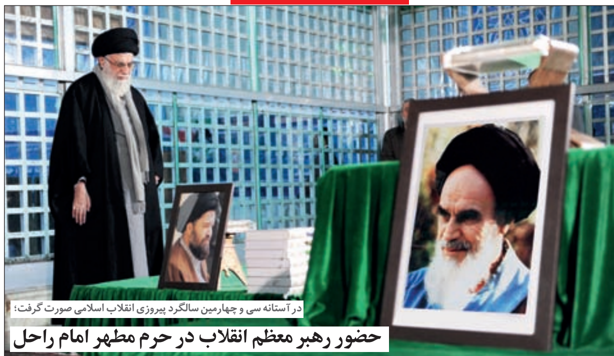
در آستانه سی و چهارمین سالگرد پیروزی انقلاب اسلامی صورت گرفت:

حضور رهبر معظم انقلاب در حرم مطهر امام راحل