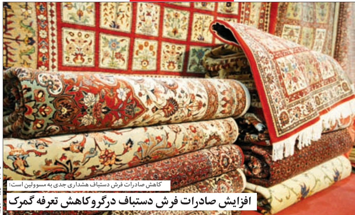
کاهش صادرات فرش دستباف هشدار جدی به مسوولین است؛ افزایش صادرات فرش دستباف در گرو کاهش تعرفه گمرک