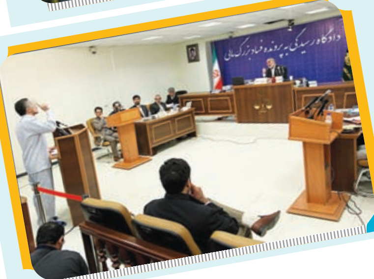
پنجمین جلسه دادگاه فساد بزرگ مالی