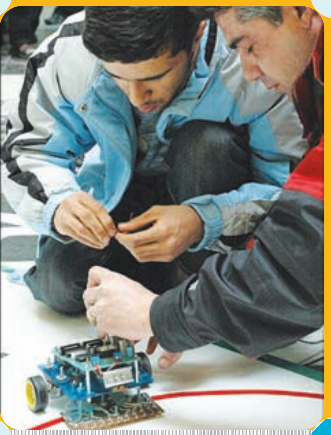
افتتاحیه مسابقات کشوری رباتیک در شاهین شهر اصفهان