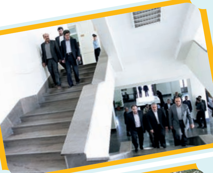
حضور استاندار اصفهان در جلسه علنی شورای شهر