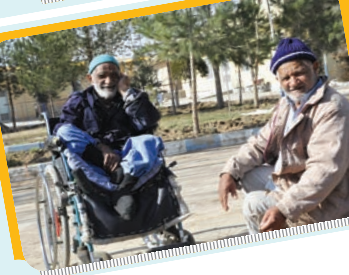
سالمندان را دریابیم روزی ما هم سالمند می شویم