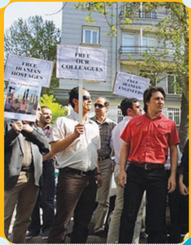
تجمع خانواده‌های هفت مهندس ربوده شده ایرانی در سوریه مقابل دفتر سازمان ملل در تهران