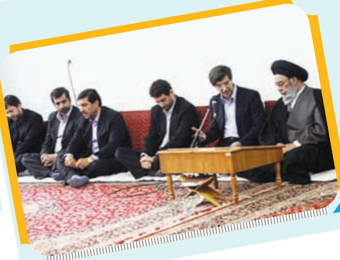
دیدار شهردار و مدیران شهری با امام جمعه اصفهان