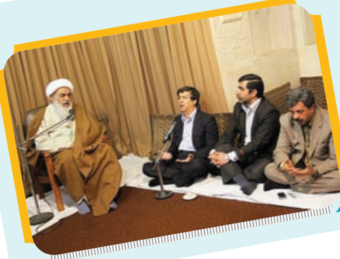
دیدار شهردار و مدیران شهری با آیت الله العظمی مظاهری