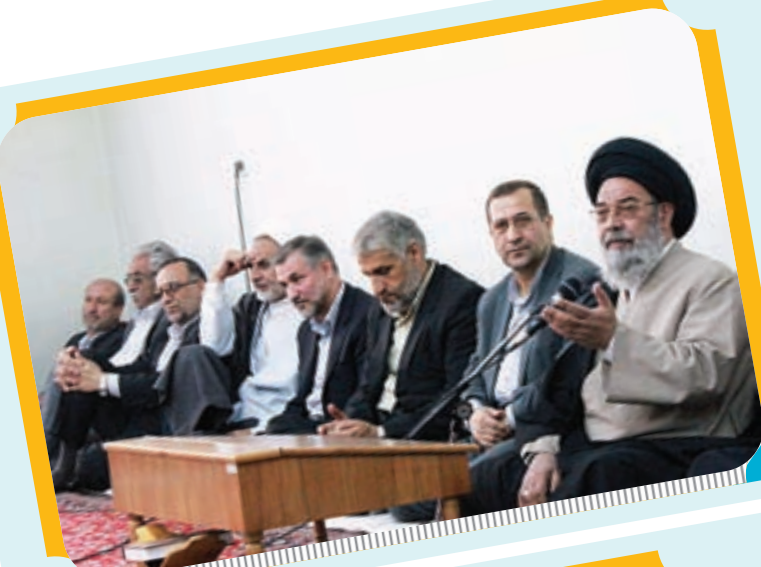
دیدار رییس و معاونین دادگستری استان با امام جمعه اصفهان