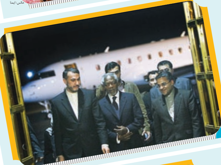
ورود کوفی عنان فرستاده ویژه دبیرکل سازمان ملل به تهران