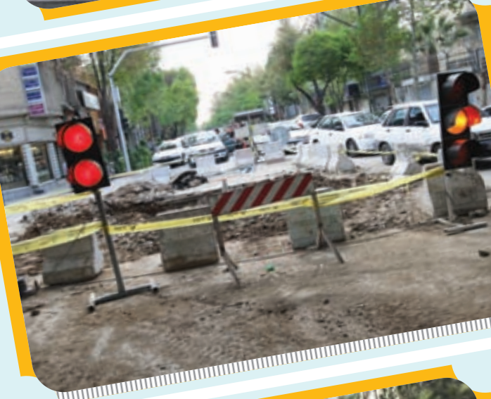
به زمین نصف جهان نیست دیگر اطمینانی