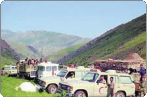
آمبولانس‌ها در راه

بعد از ناهار ولو شده بودیم داخل داستان سنگر. روزهای اولی بود که به خط مقدم اعزام شده بودیم. شیرینی خواب بعد از ناهار، پلک‌ها را سنگین کرده بود. خط آرام بود.