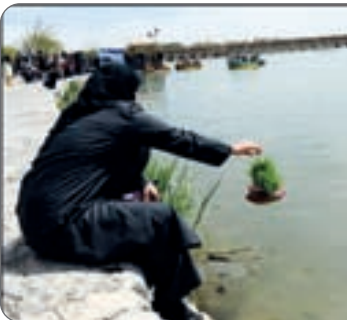
خودمان را دست کم نگیریم. هر

هرگز شک نکن که یک کمک ساده یک قدم بسیار بزرگ است.