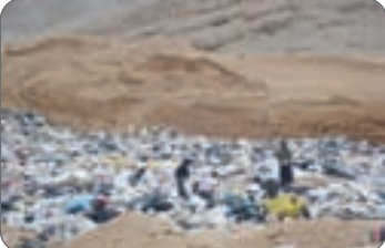
تولید میکروبیها و رشد حشرات فراهم می‌کند

شیرابه‌های باز مانده از زباله‌ها نیزاز جمله معطلاتی است که بویژه در سال‌های اخیر توجه مدیریت‌های شهری را در جهان به خود جلب کرده‌است.