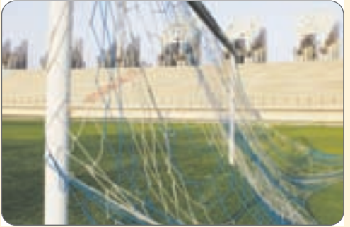
در نامه‌ای به معاون راهبردی رییس جمهور