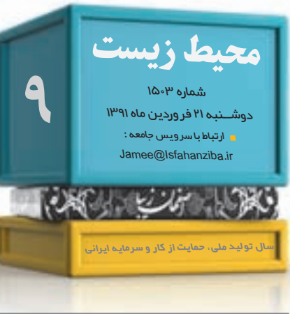
سال تولید ملی، حمایت از کار و سرمایه ایرانی