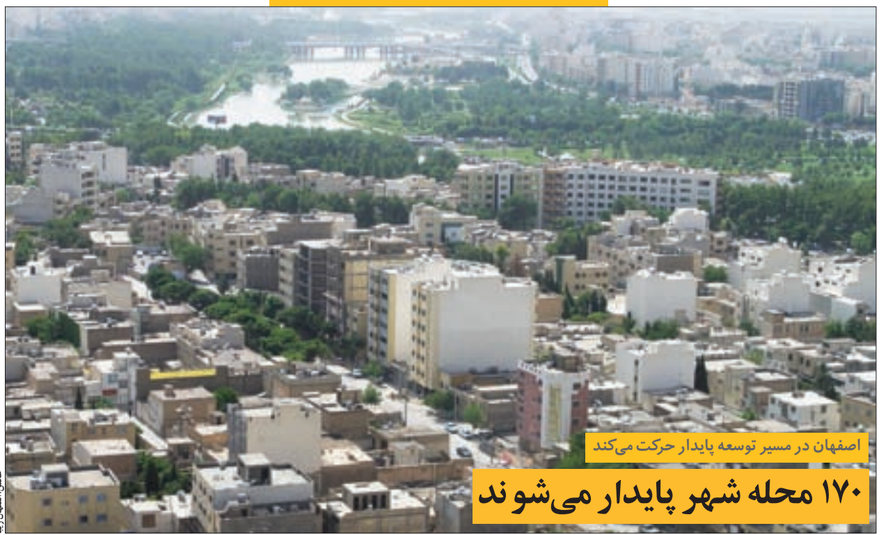
اصفهان در مسیر توسعه پایدار حرکت می کند