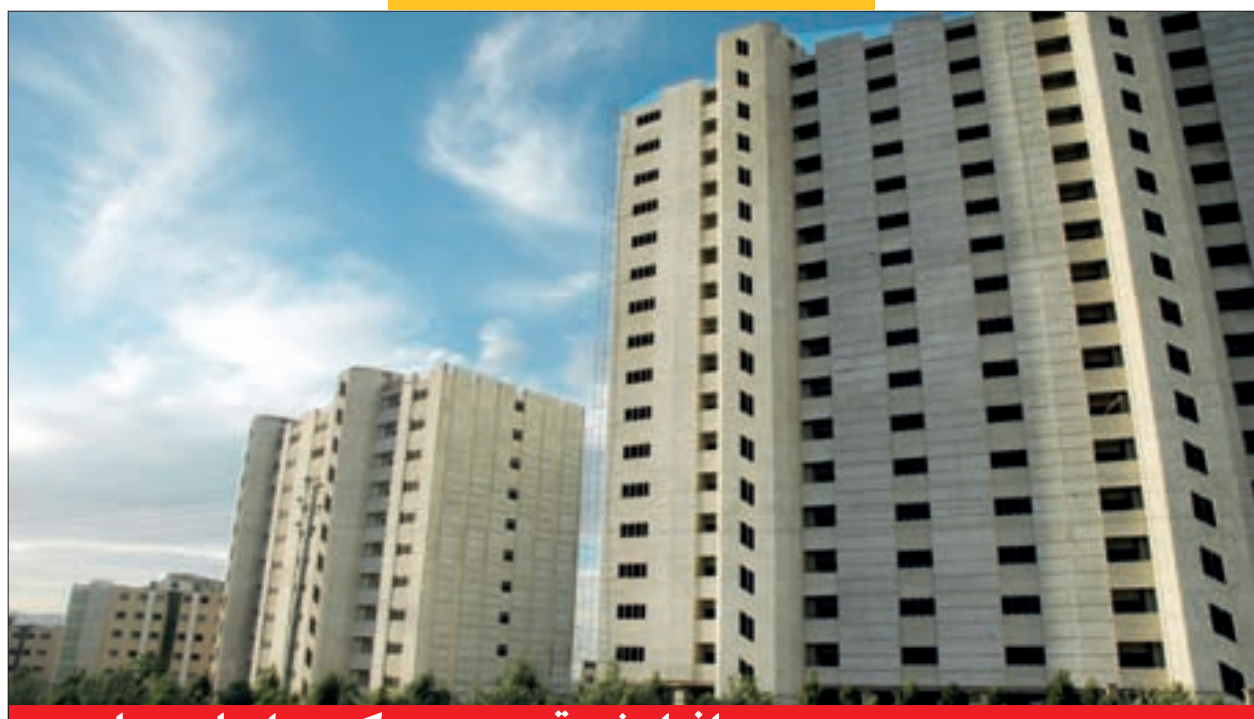
تثبیت قیمت مسکن در سال ۹۱ عدم افزایش قیمت مسکن و اجاره بها